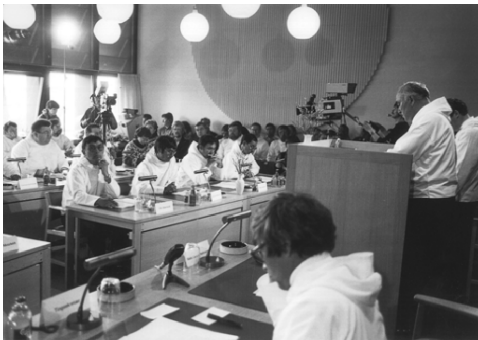
Landstingssalen anno 1984.

Salen har i dag nået sin kapacitetsgrænse og der kan være meget trangt under debatterne, som gennem årene har oplevet en voksende opmærksomhed fra omverdenen og dermed en stigende interesse fra journalister, udenlandske gæster og befolkningen, der alle skal kunne følge med direkte fra stedet.