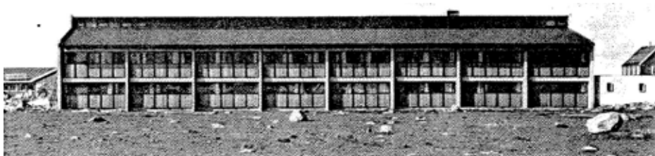
I 1966/67 faldt startskuddet til opførelsen af et helt bygningskompleks, hvoraf den første blev "Bygning B".

Der skulle dog gå otte år, inden Landsrådet kunne flytte over i sin del af det nye bygningskompleks. Da opgaverne under Social- og Arbejdsdirektoratet blev overtaget af Landsrådet i 1970, var der behov for yderligere plads til administrationen på Mestervej, hvorfor udenbys medlemmer fremover boede på Hotel Godthåb, og Landsrådets møder blev afholdt forskellige steder rundt i byen, bl.a. i Menighedssalen i Hans Egedes kirke og i gymnastiksalen i skolen ASK (Atuarfik Samuel Kleinschmidt), inden Landsrådet i 1975 endelig kunne flytte fra Mestervej til den nye Landsrådssal ("Bygning G").