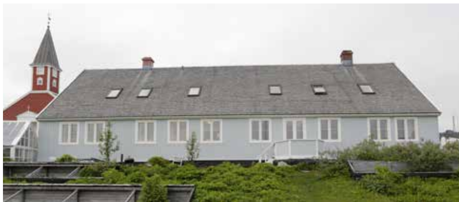
Det nuværende Rigsombudsmands hus (opført i årene 1831-33) har tjent som mødested for både Godthåbs forstanderskabsråd og Sydgrønlands Landsråd.

Grønlands parlamentariske historie begynder tilbage i 1857, hvor det første forstanderskabsråd blev etableret i Godthåb. Baggrunden for forstanderskaberne var et forslag, som bl.a. inspektør Rink og seminarieunderviser Kleinschmidt havde indsendt til Indenrigsministeriet i 1856 – og året efter startede de på forsøgsbasis i Sydgrønland. Forstanderskaberne skulle fungere som en slags lokale råd bestående af danske embedsmænd og en anset fanger fra hver plads i distriktet med missionæren som formand. Som repræsentative organer i de grønlandske distrikter skulle de tage sig af lokale stridigheder og sociale problemer og dermed danne grundlag til begyndende grønlandsk selvforvaltning. Rink håbede på denne måde at højne befolkningens levestandard ved at se grønlænderne modne i politisk henseende, og dermed at kunne indlede en udvikling hen imod selvstyre og demokrati.