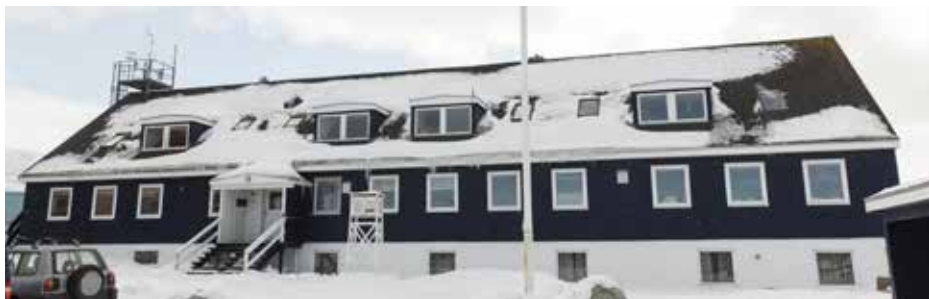
I tre år hold Landsrådet sine møder på Mestervej.

Da Erling Høegh i 1967 blev den første folkevalgte formand for Landsrådet, skulle der også ske en fysisk adskillelse fra Statens administrationsbygning. Landsrådet flyttede over til en nyopført bygning på Mestervej, hvor der også var værelser til de udenbys landsrådsmedlemmer.