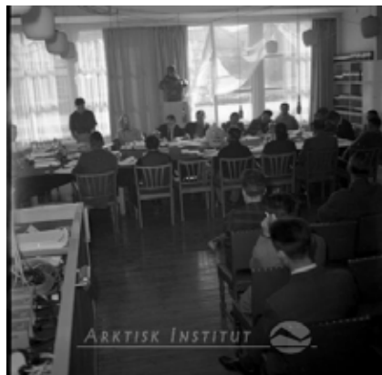
Landsrådsmøde i 1961 i den røde barakbygning ved Indaleeqqaq Aqqutaa.

Fra 1953 holdt Landsrådet sine møder i en baraklignende bygning ved Indaleeqqaq Aqqutaa, som gav plads til landshøvdingen, kærnerkontoret (byens styring) og landsrådet. Mødesalen blev samtidigt brugt som retssal.