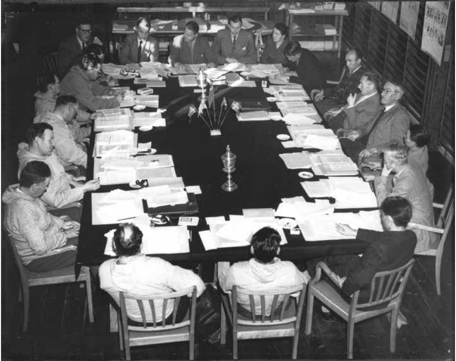
Det første folkevalgte Landsråd i 1951 i Seminariets gymnastiksal.