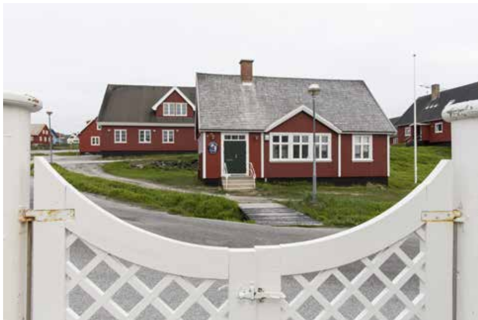
Bygningen på den modsatte siden af vejen set fra porten til daværende Landsfogedens hus.

Allerede to år efter sin ibrugtagning stoppede landsrådene deres virke på grund af krigen, og i stedet for flyttede det såkaldte "Centralkontor" ind i bygningen, hvorfra hele den grønlandske centraladministration med Eske Brun i spidsen efterfølgende blev styret.