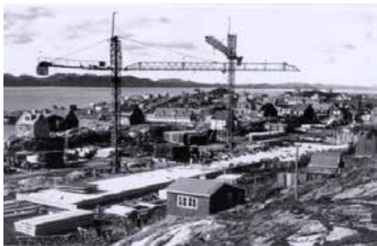
I 1966/67 faldt startskuddet til opførelsen af et helt bygningskompleks, som bl.a. skulle huse Landsrådet.

I samme år faldt startskuddet til opførelsen af et helt nyt bygningskompleks, der i fuldt udbygget stand skulle rumme landsrådssekretariatet med tilhørende landsrådssal samt landsadministrationen under landshøvdingeembedet. Bygherre var Ministeriet for Grønland. Den første bygning med betegnelsen "Bygning B" blev placeret på grunden, der danner overgangen mellem den gamle kolonihavn og det nye Godthåb. Bygningen var den første i det kompleks, der indtil bygningen af Nuuk Center i 2012 udgjorde kernen i Selvstyrets administrationsbygninger.