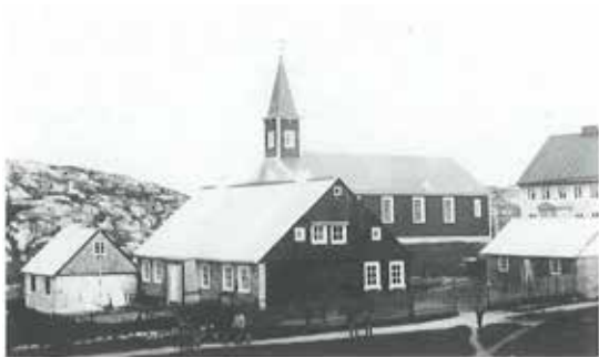
Inspektørboligen efter ombygningen i 1872. Til venstre stenhuset, hvor Godthåbs forstanderskab mødtes.