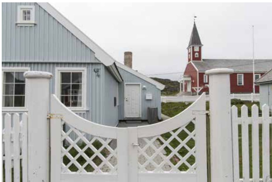
Porten til daværende Landsfogedens hus.

Den nye landsrådssal blev sammen med husets øvrige ombygning indviet og taget i brug under festlige former i 1925, og det første egentlige landsrådsmøde i huset blev afholdt året efter. Husets landsrådssal fik en levetid på 11 år. I 1937 flyttede Sydgrønlands Landsråd ind i en nyopført bygning på den modsatte side af vejen.