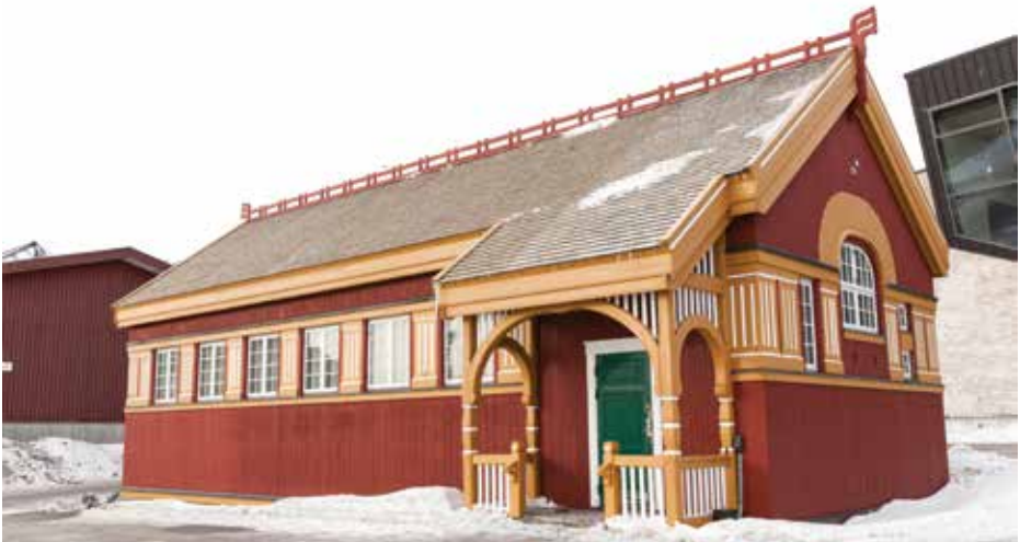
Seminariets gymnastiksal fra 1908 blev bl.a. brugt til landsrådenes skelsættende møde i med statsminister Hans Hedtoft.

Det nu sammenlagte Landsråd havde 13 medlemmer og holdt sine første møder fortsat i Seminariets gymnastiksal, inden det flyttede over til baraklignende bygninger ved Indaleeqqap Aqquataa i 1953.