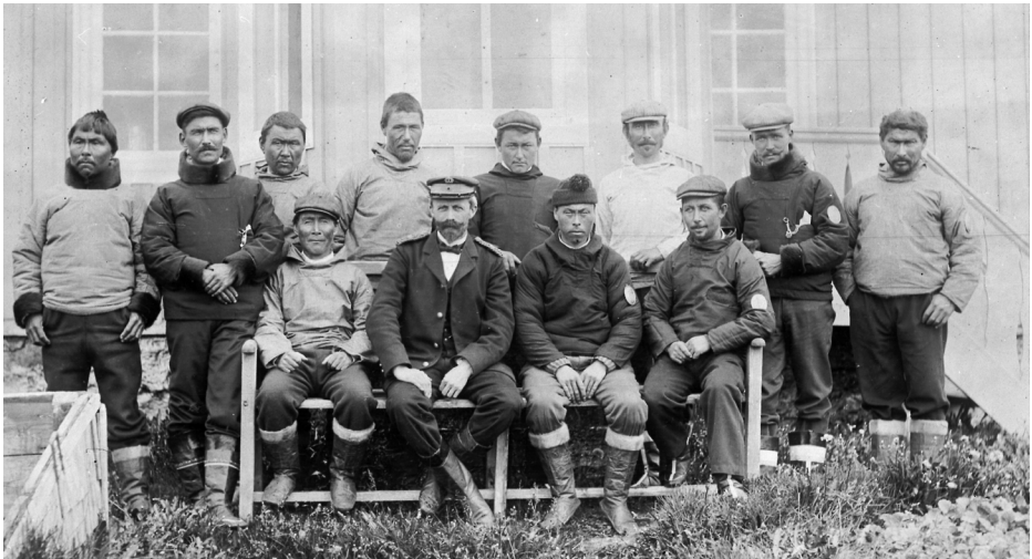
Sydgrønlands Landsråd på sit første møde i Godthåb i 1911.

til opførelse af nye huse rummede dagsorden godkendelse af valglisterne, en redegørelse for fælleskassens benyttelse indtil Landsrådets sammentræden, forhandling om bevillinger i henhold til en kongelig anordning, fordeling af de af Indenrigsministeriet bevilgede anmagssatgarn og regler for deres benyttelse, fremlæggelse af forslag til forsøg med rævestutteri ved Godthåb og om udsendelse af motorfartøj til hvalrosfangst i Davisstrædet, en drøftelse af en ændring af reglerne for valgret og valgbarhed, af nye regler for repartitionsfordelingen samt af forslag til regler for ydelse af alimentationsbidrag.