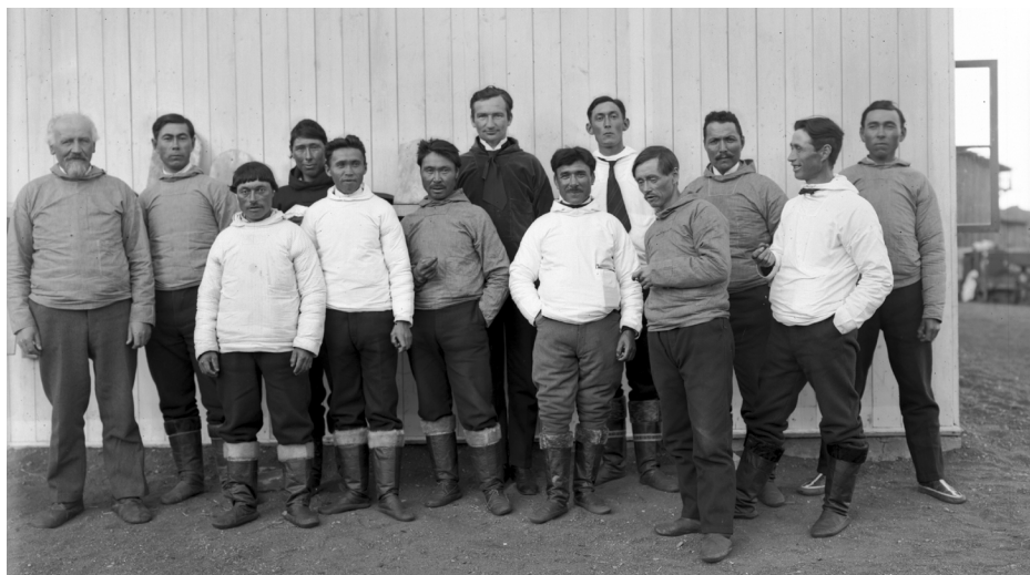
Nordgrønlands Landsråd ved Arktisk Station i Godhavn i 1929. Det har ikke været muligt at finde et billede fra rådets første møde i 1911.

en lånekasse til anskaffelse og fornyelse af huse og erhvervsredskaber, om fælles anmagssatindsamling, om regler for en ulykkesforsikring for personer, der udfører tjeneste i handlens, administrationens eller kirke- og skolevæsenets tjeneste, om ydelse af byggelån og byggetilskud ved nybygninger og ombygninger af grønlandske huse eller om fastsættelse af regler for valgret og valgbarhed til kommunerådene.