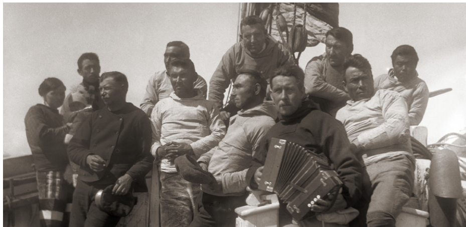
Sydgrønlands Landsrådsmedlemmer på vej til møde sammen med præster og kateketer ombord på et af disktriktsfartøjerne, sandsynligvis motorskonnerten "Bjørnen".