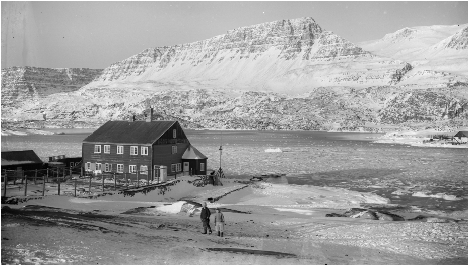
Landsfogedboligen i Godhavn i 1917.

ganer i de 62 kommuner, var de to Landsråd for henholdsvis Nordgrønland og Sydgrønland en nyskabelse, som var tiltænkt større opgaver. Styrelsesloven medførte udover etableringen af Kommuneråd og Landsråd også, at retsplejen udskiltes med en egen ordning.