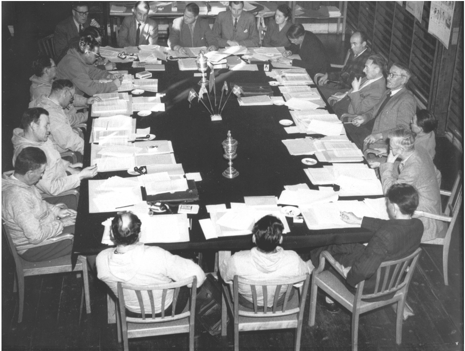
Det første folkevalgte Landsråd i 1951.

Ved Selvstyrets indførelse den 21. juni 2009 blev begrebet "Landstinget" med Loven om Selvstyre i Grønland ændret til "Inatsisartut".