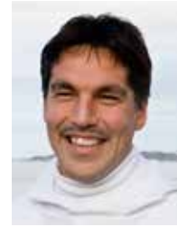
Aqqaluaq B. Egede