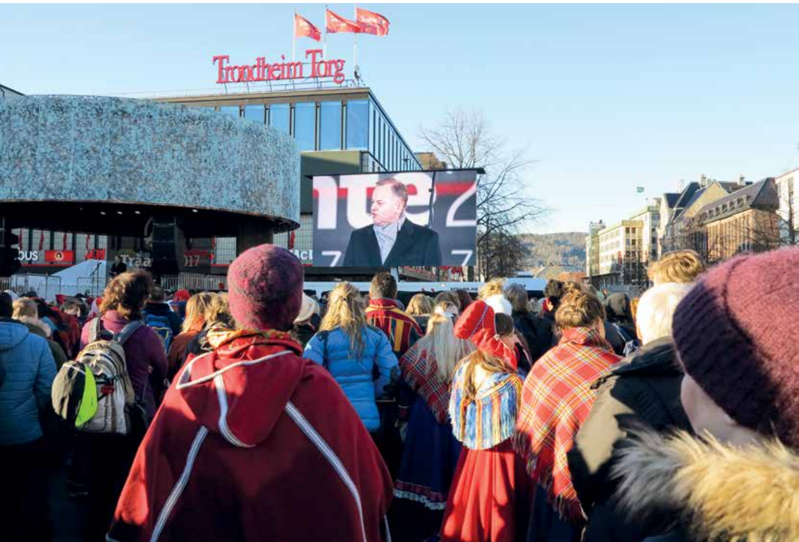
Den 6. februar: Formandskabet deltog i Samernes 100-års jubilæum "Tråante 2017" i Trondheim, Norge.