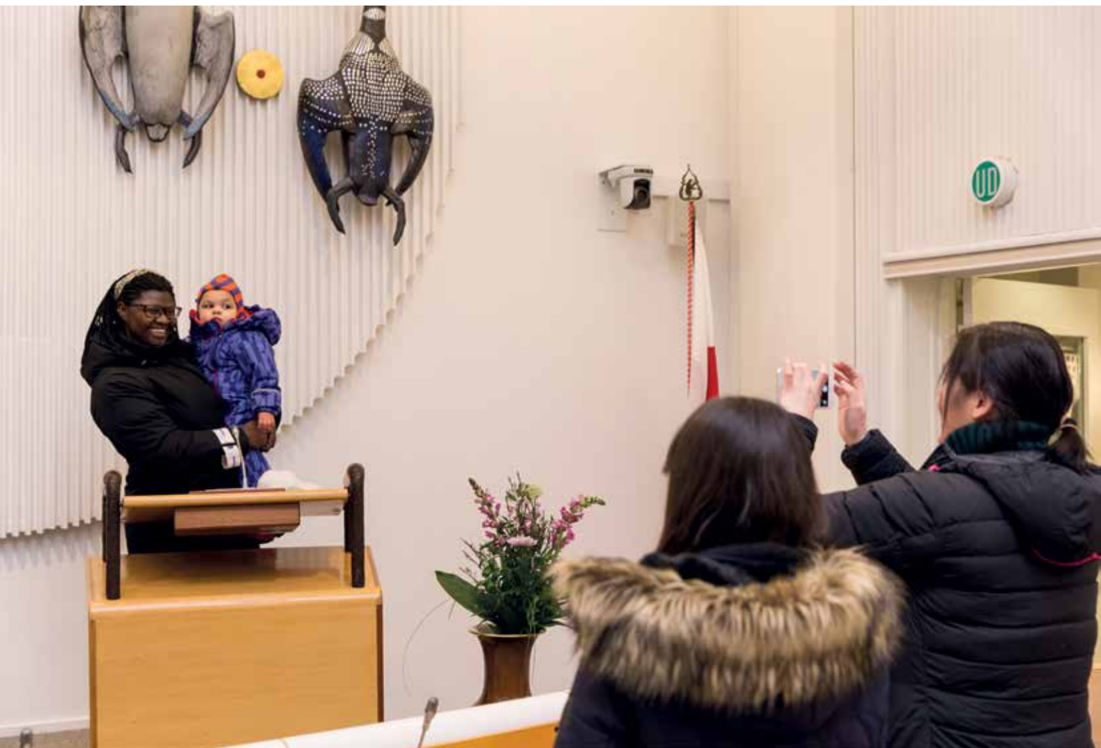
Den 21. januar: Inatsisartut holdt åbent hus i anledning af kulturnatten.