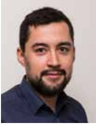
Múte Bourup Egede