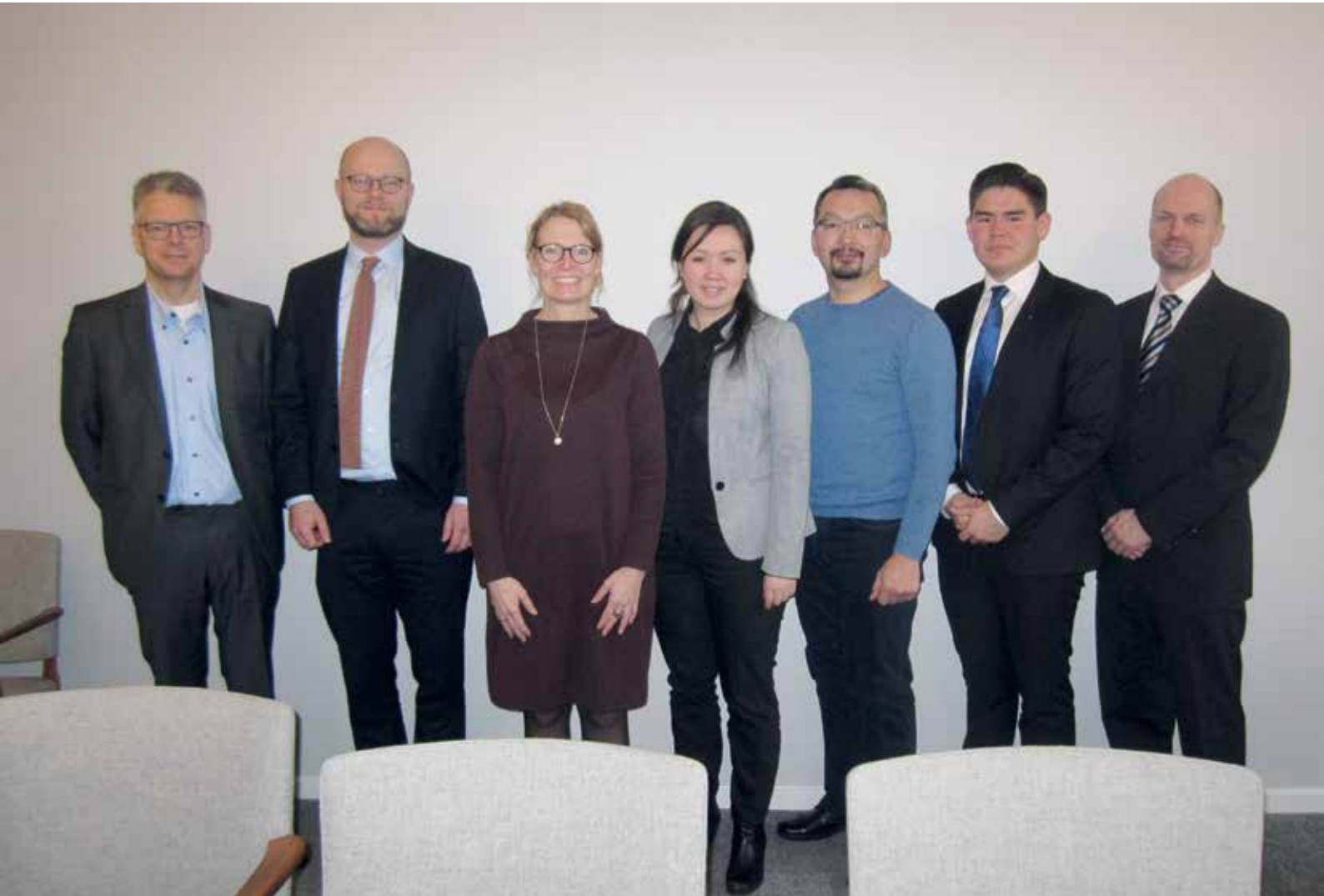
Den 31. januar besøgte Revisionsudvalget den danske Rigsrevision i København.