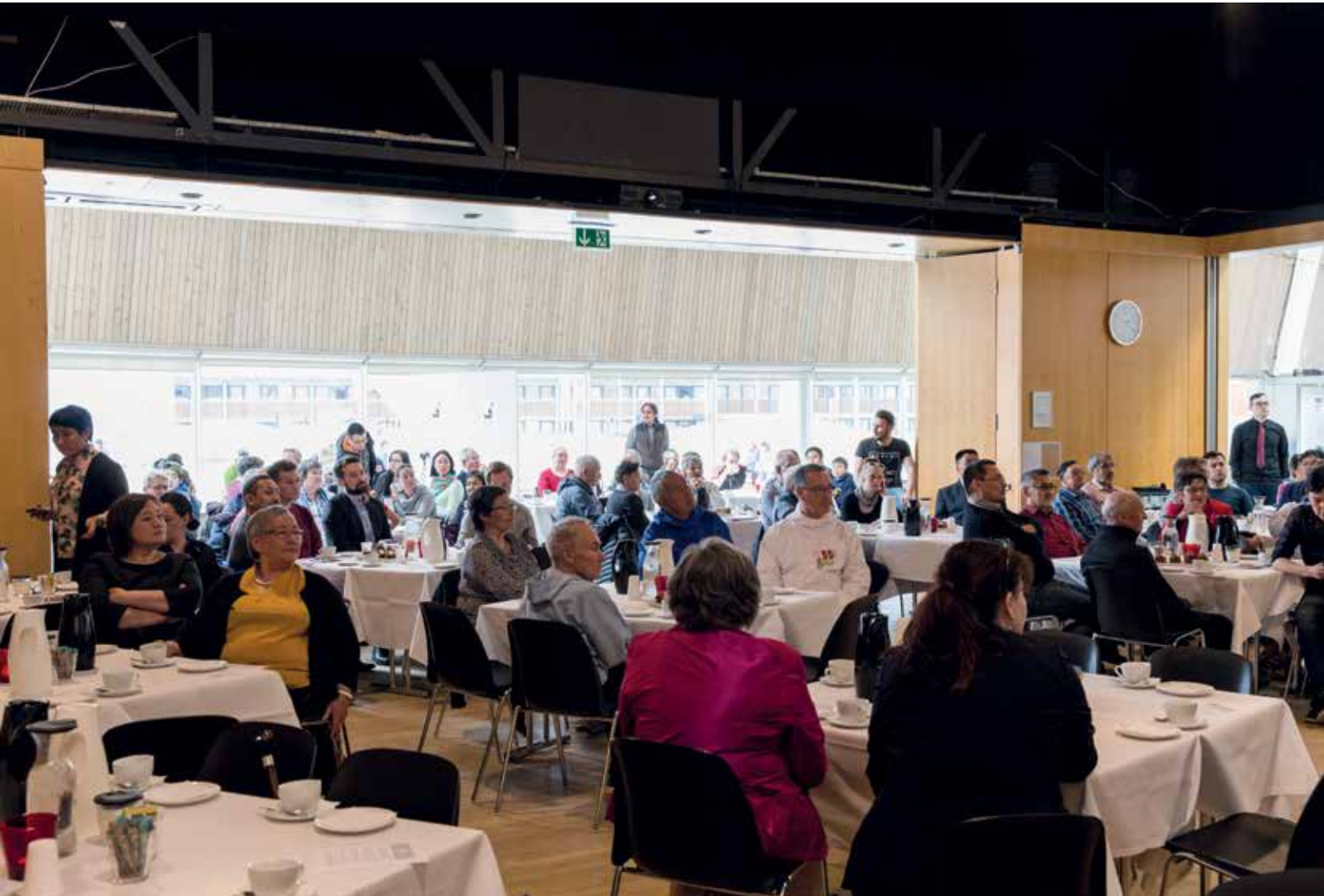
Der var godt 100 fremmødte til markeringen af 50-års dagen.