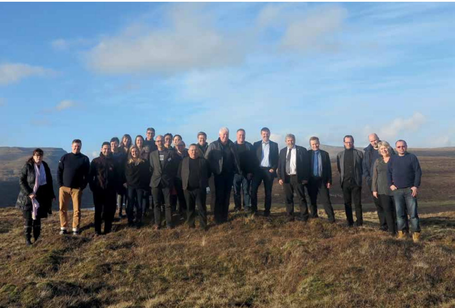
Vestnordisk Råds temakonferenc fra den 25. til den 27. februar i Tórshavn.