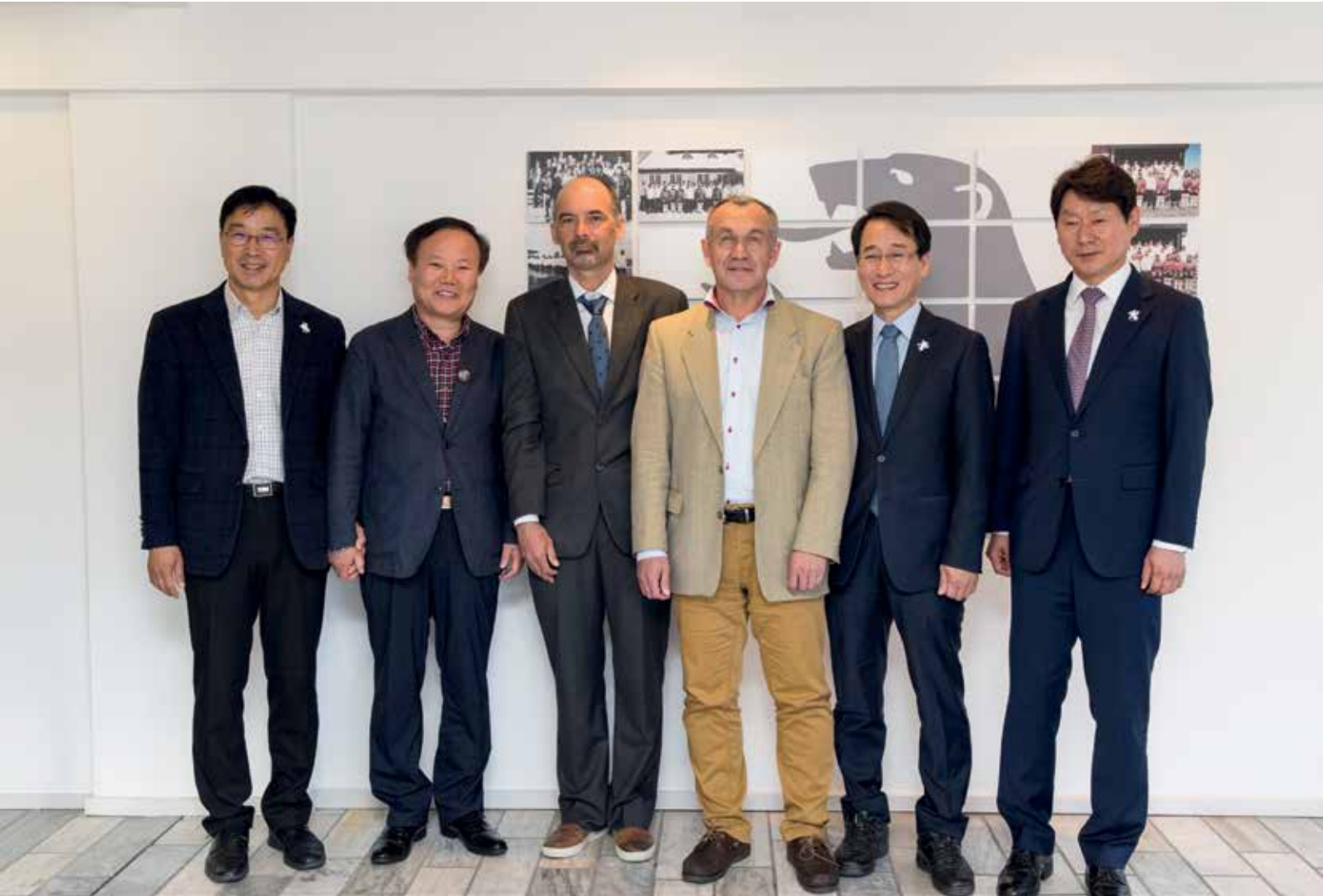
Den 24. juli: Repræsentanter fra Inatsisartut mødtes med medlemmer af det koreanske parlament.