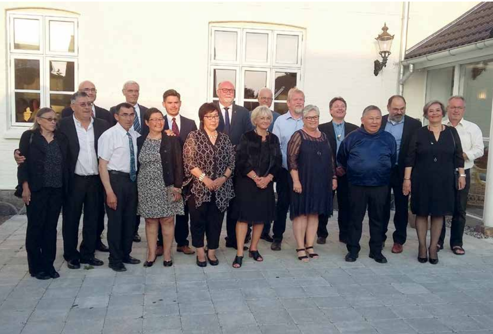
Den 29. august: Kontaktudvalgsmøde med Folketingets præsidium på Samsø.