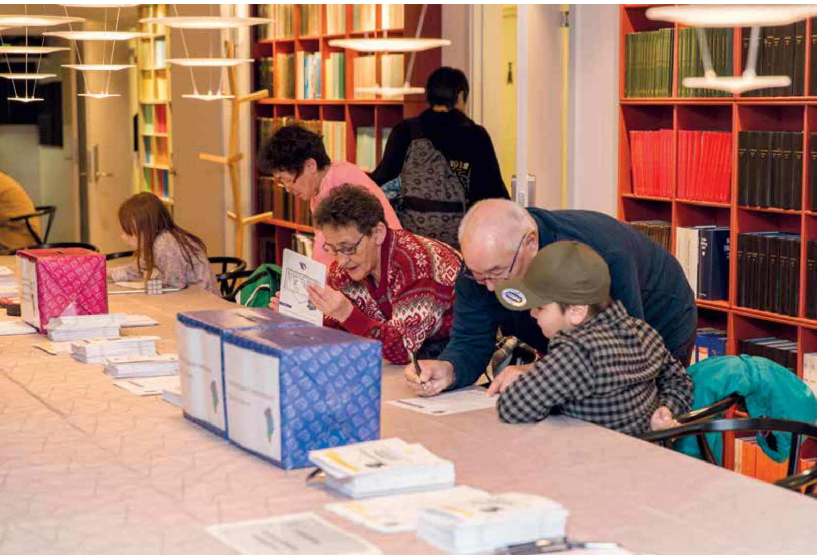
Børne- og voksenquiz i Inatsisartuts mødelokaler.