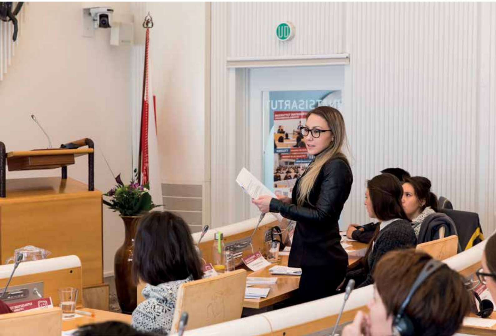
Efter tre dages gruppearbejde afholdt Ungdomsparlamentet sin samling i Salen.