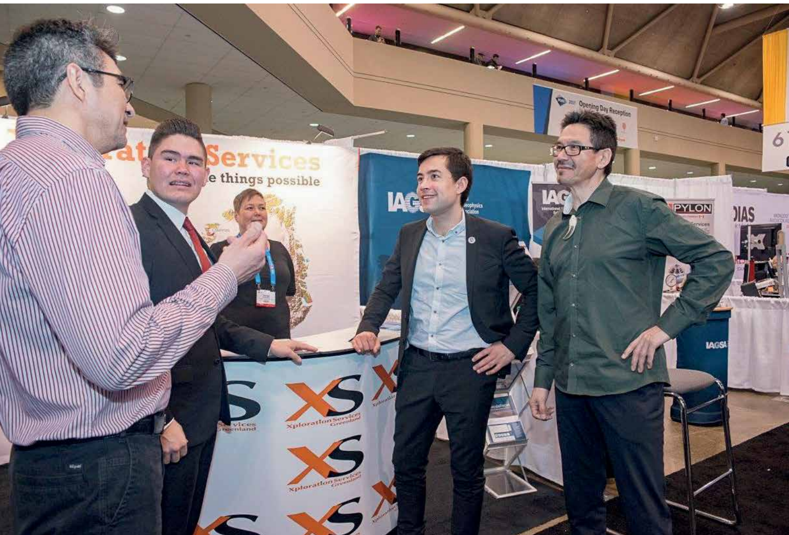
Erhvervs- og Råstofudvalg deltog i Råstof- og mineralmessen PDAC i Toronto fra den 3.-9. marts.