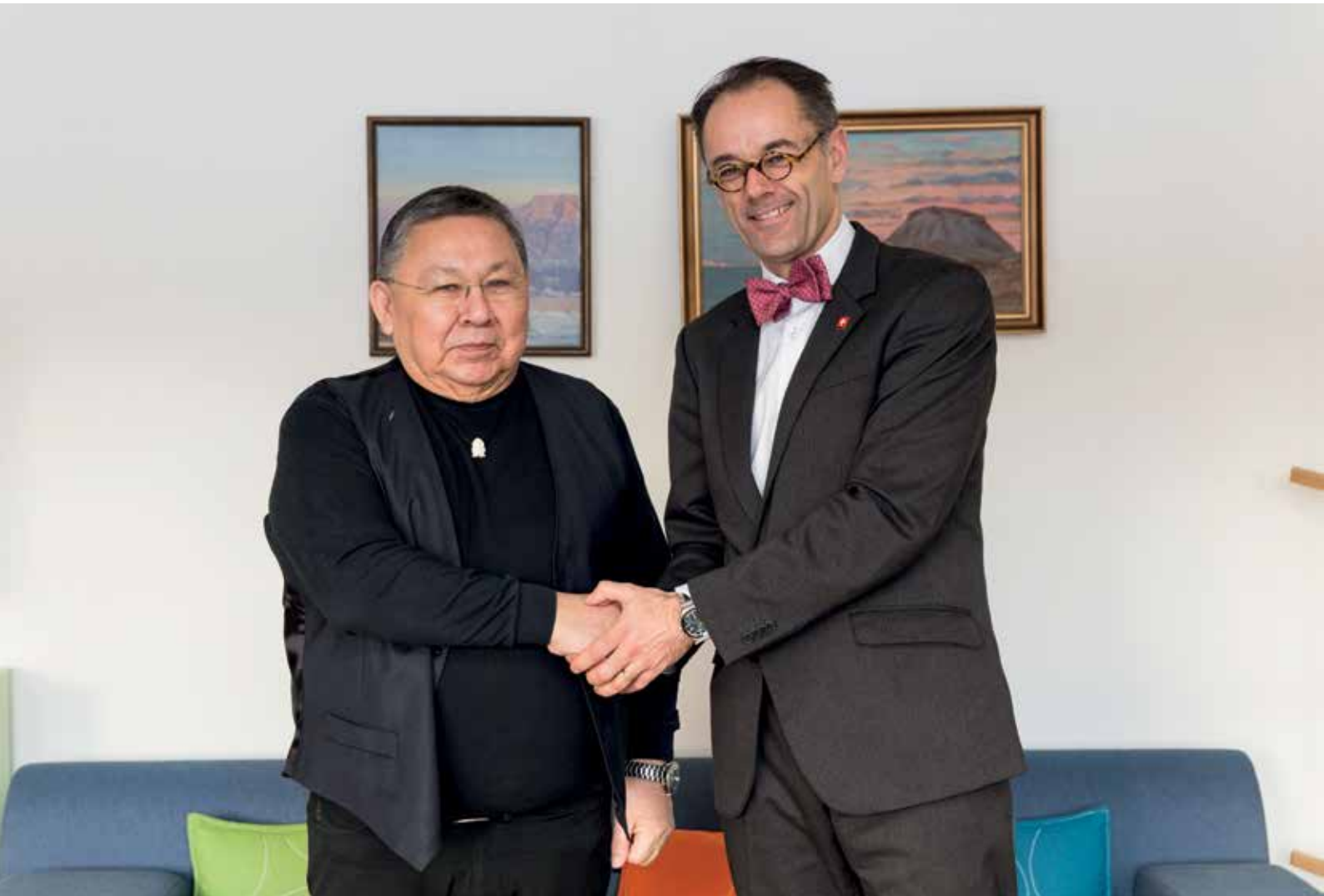
Den 31. januar: Møde med den schweiziske ambassadør i Danmark Benedikt Wechsler.