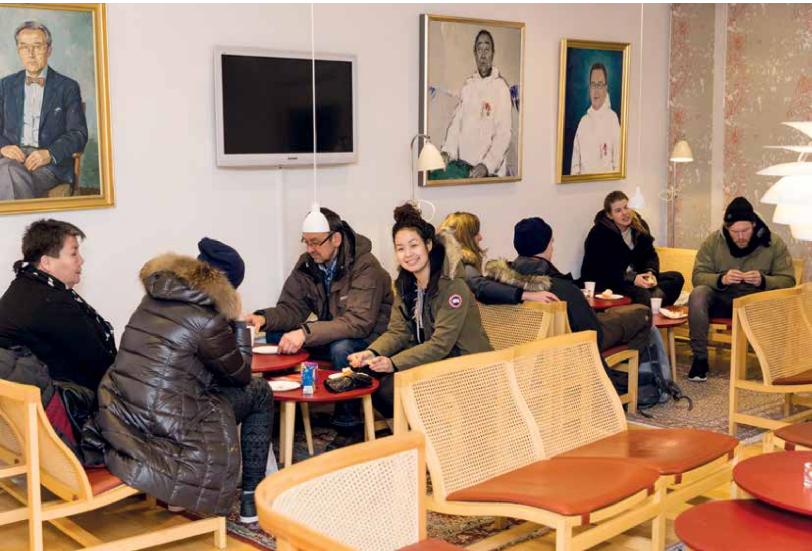
Der hygges i medlemmernes kaffestue.