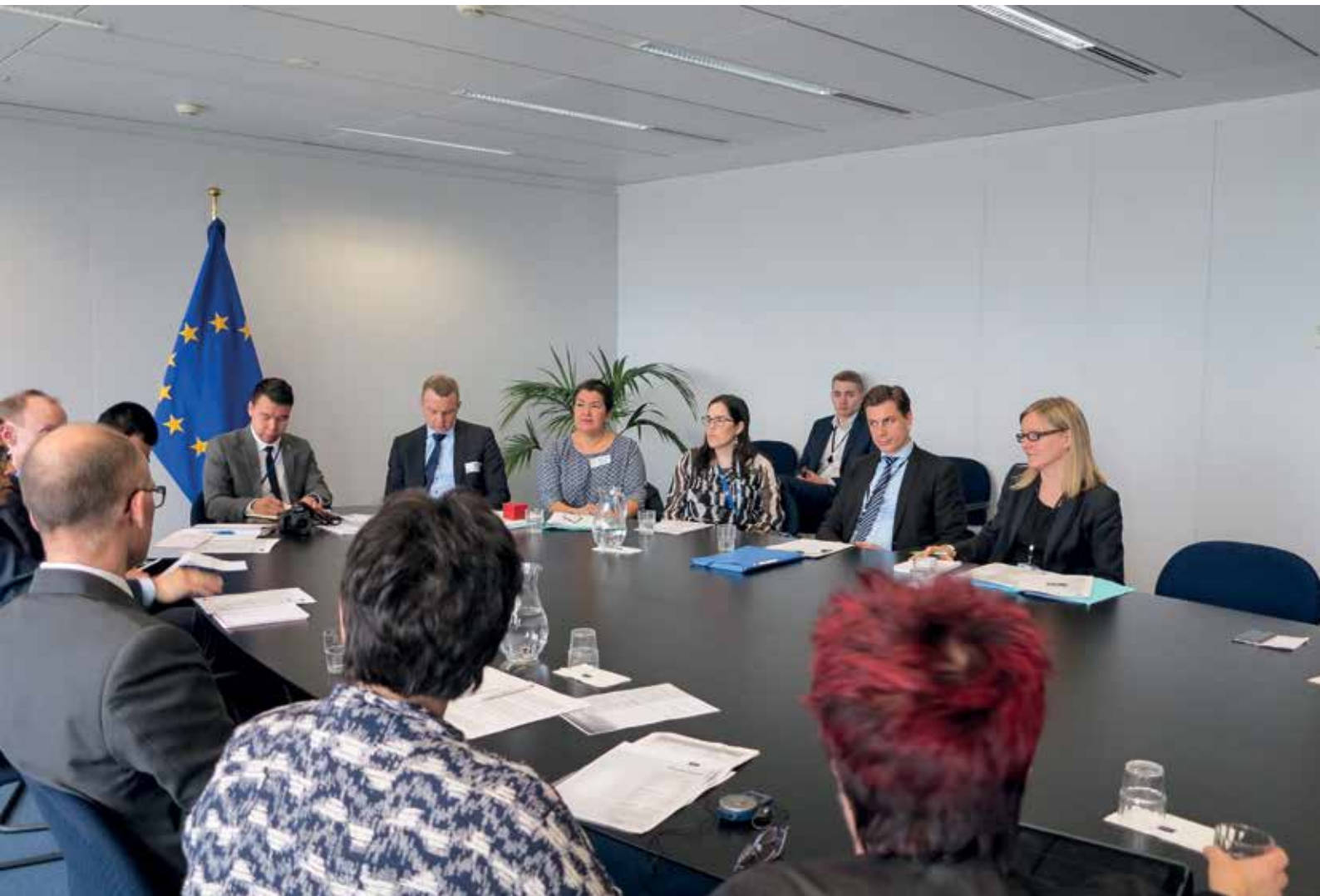
Den 20. marts var Fiskeri-, Fangst- og Landbrugsudvalget og Udenrigs- og Sikkerhedspolitisk Udvalg sammen med Folketingets Grønlandskudvalg i Bruxelles.