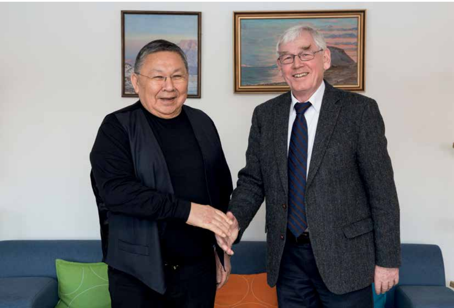
Den 22. februar: Møde med tidligere dansk EU-kommissær Poul Nielson.