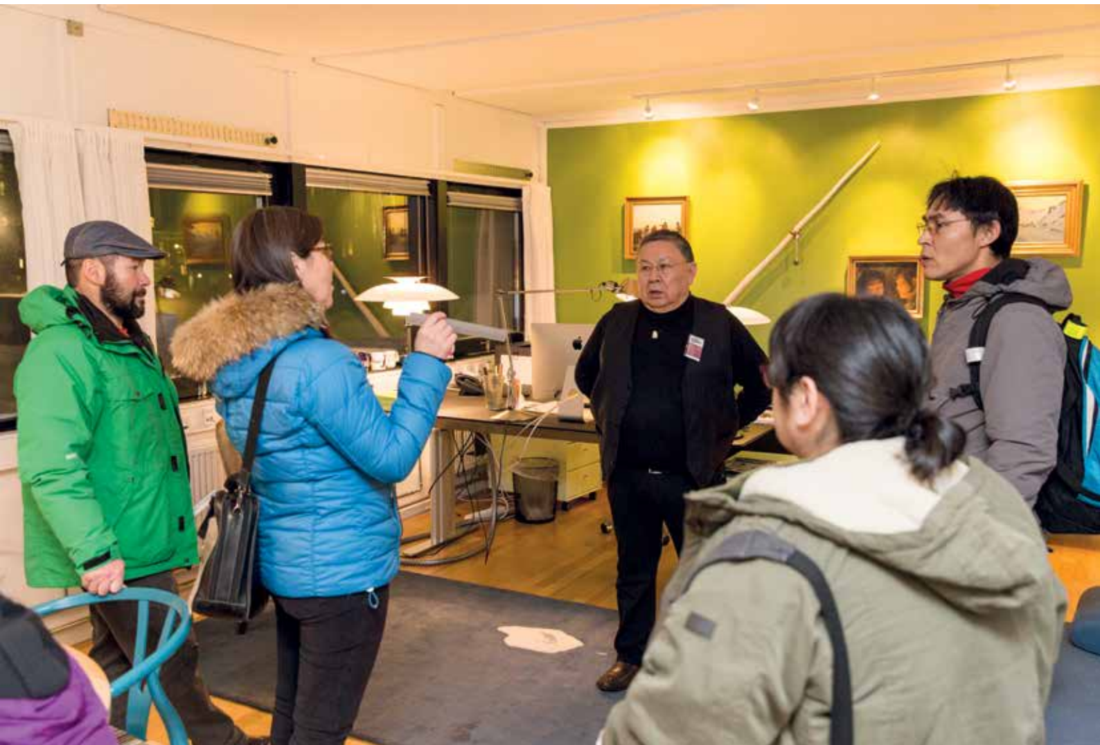
Gæster på formandens kontor.