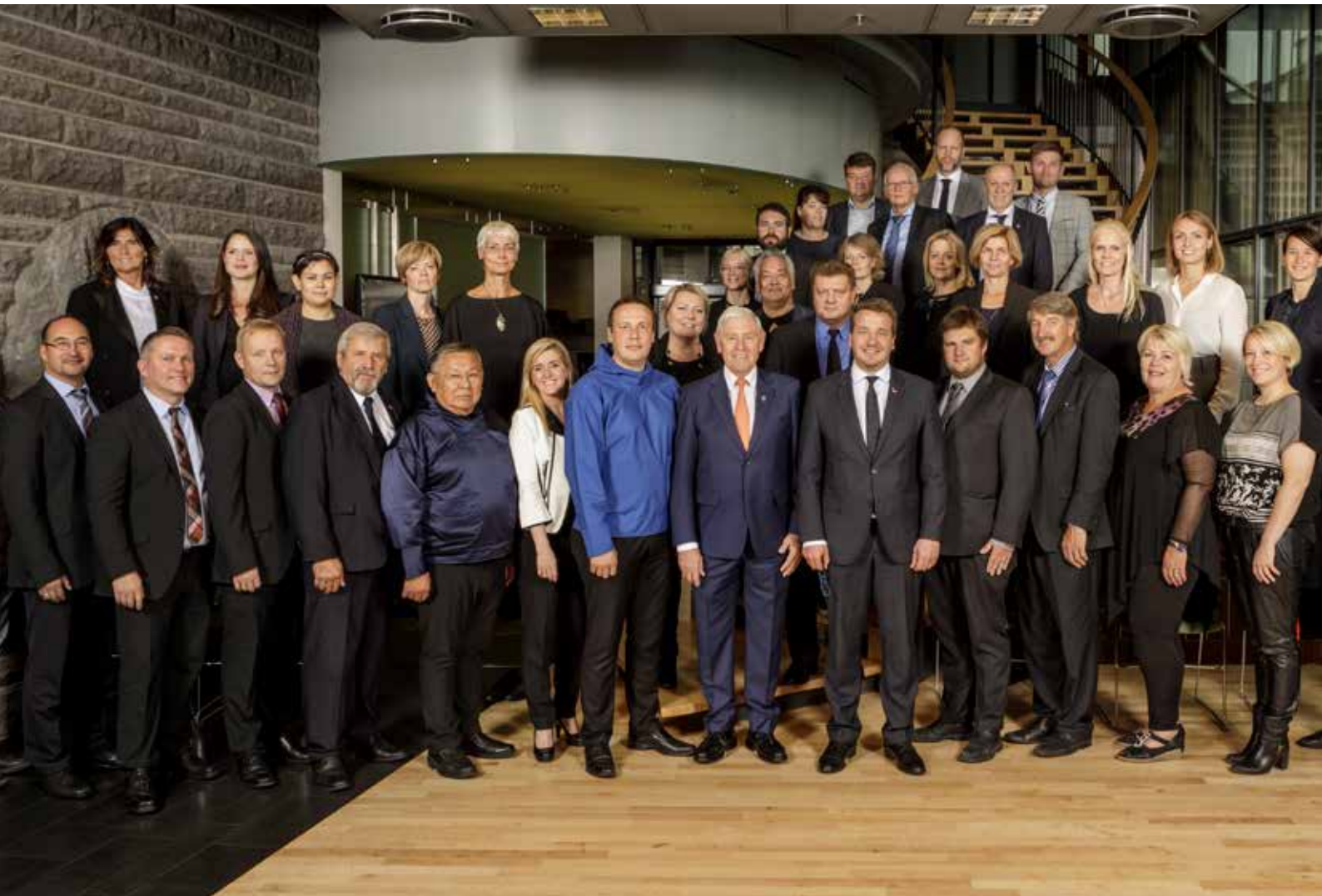
Vestnordisk Råds årsmøde fra den 31. august til den 1. september i Reykjavík.