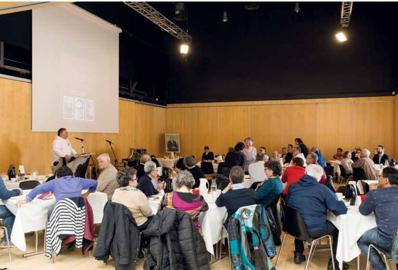
Den 26. maj markerede Inatsisartut, at Landsrådet den samme dag for 50 år siden for første gang valgte sin folkevalgte formand af sin midte.