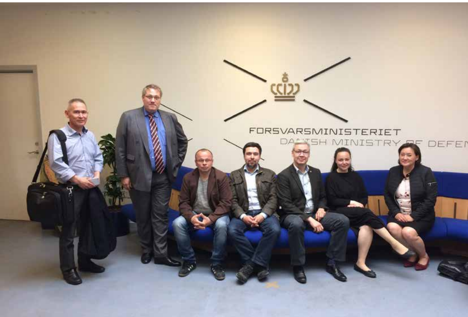
Den 16. juni var tre repræsentanter fra Anlægsudvalget sammen med to repræsentanter fra Finans- og Skatteudvalget inviteret til at deltage i et møde i Forsvarsministeriet.