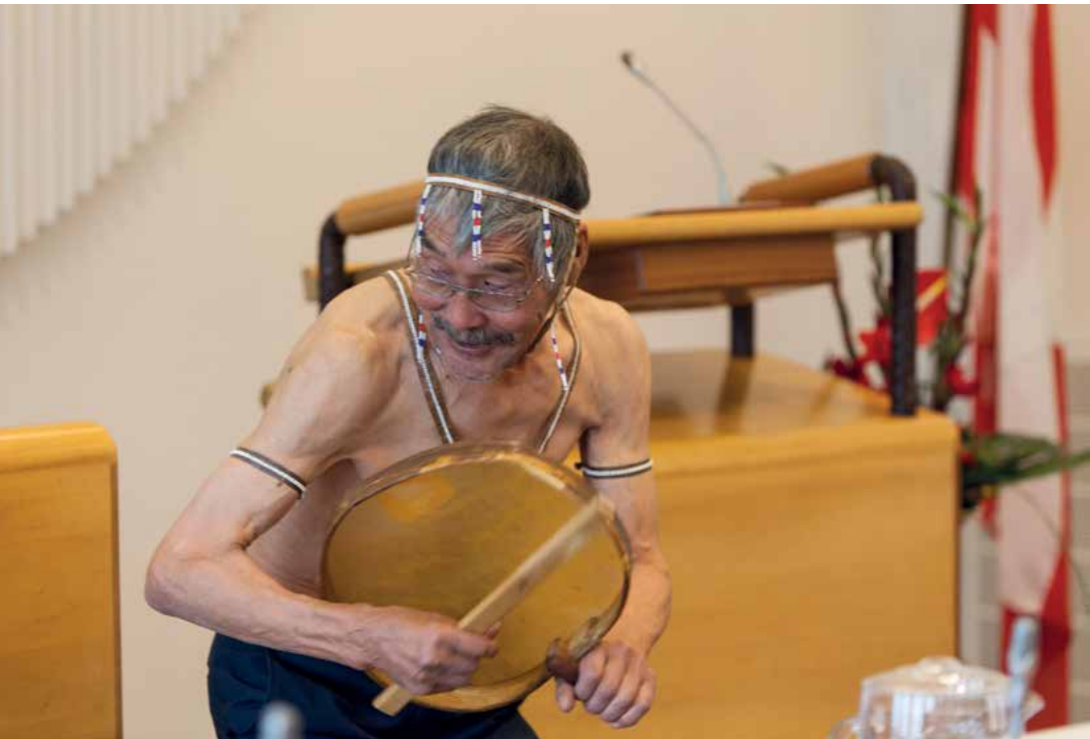
Den 22. september: For første gang blev efterårssamlingen indledt med trommedans.