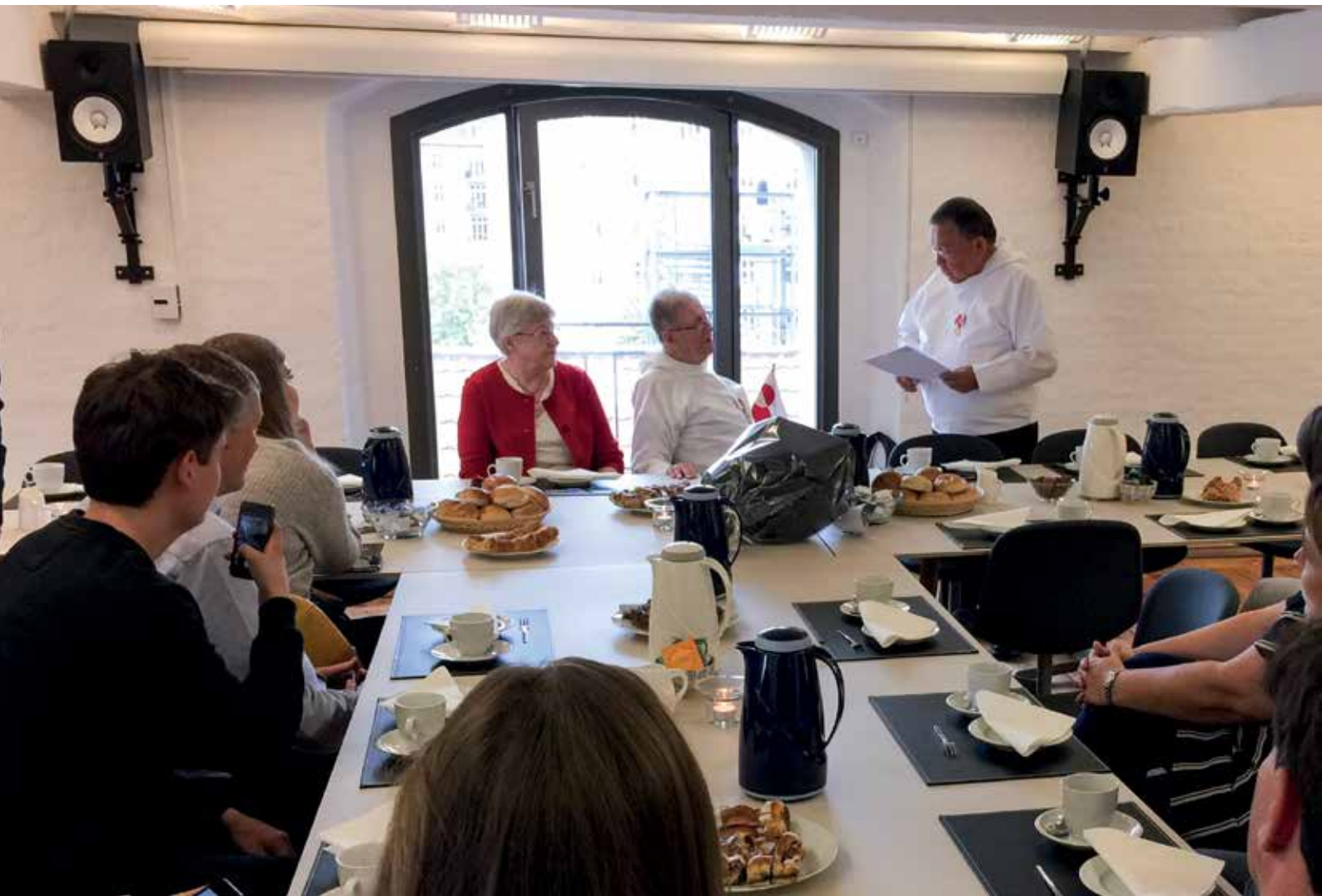
Den 5. september fik tidligere medlem af Landsrådet Oluf Høegh tildelt en Nersornaat i guld i København som anerkendelse for sin lange og engagerede politiske indsats for Grønland.