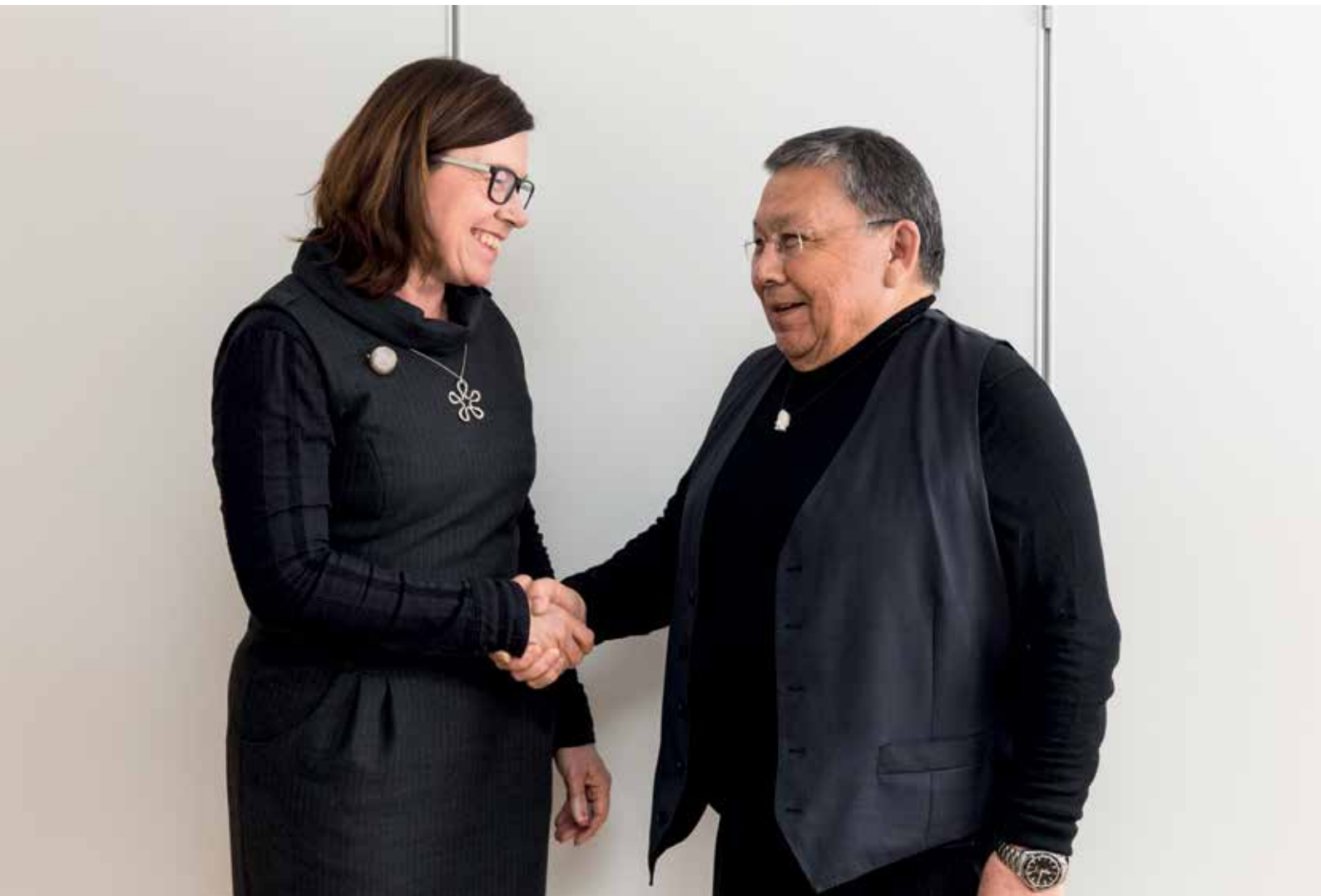
Den 26. april: Møde med Nordisk Råds præsident Britt Lundberg om arbejdet i Inatsisartut, herunder det vestnordiske samarbejde.