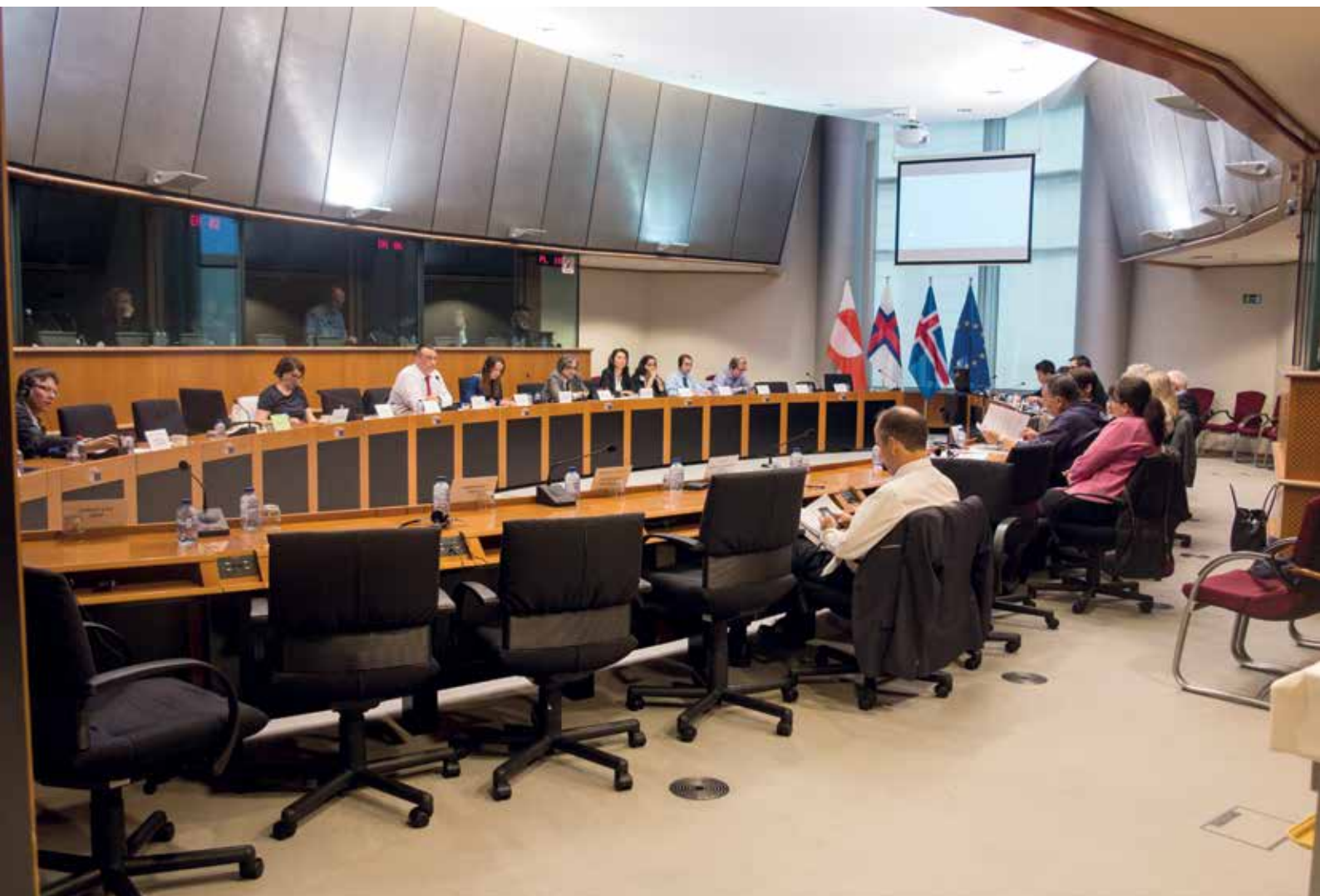
Vestnordisk Råds præsidiemøde i Bruxelles og møde med Europa-Parlamentet den 28. juni.