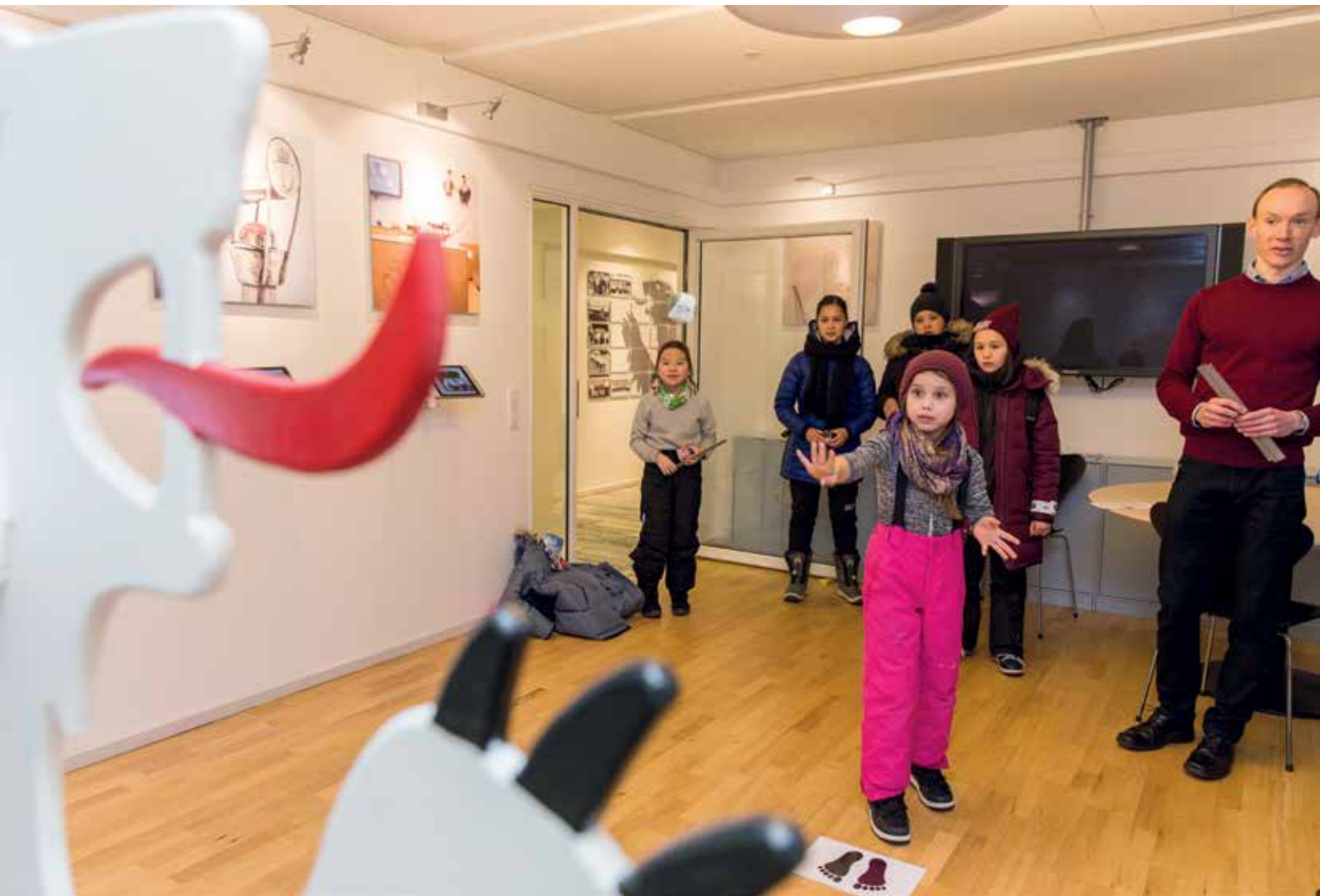
Boldkast for børn.