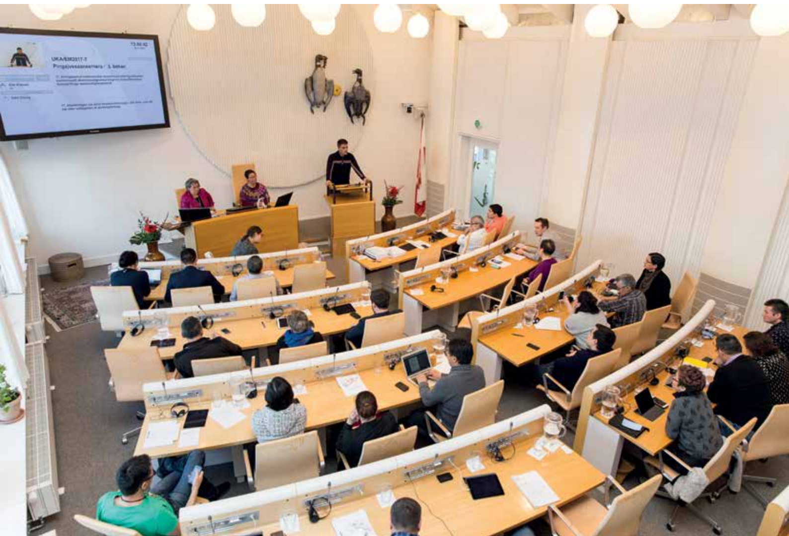
Efterårssamlingen 31. mødedag den 20. november.