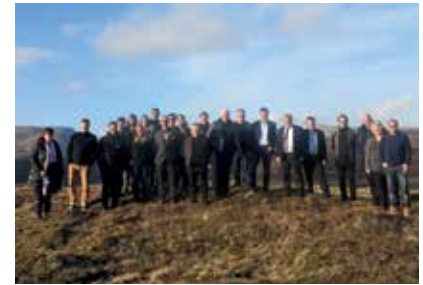
Vestnordisk Råds årsmøde i Reykjavik