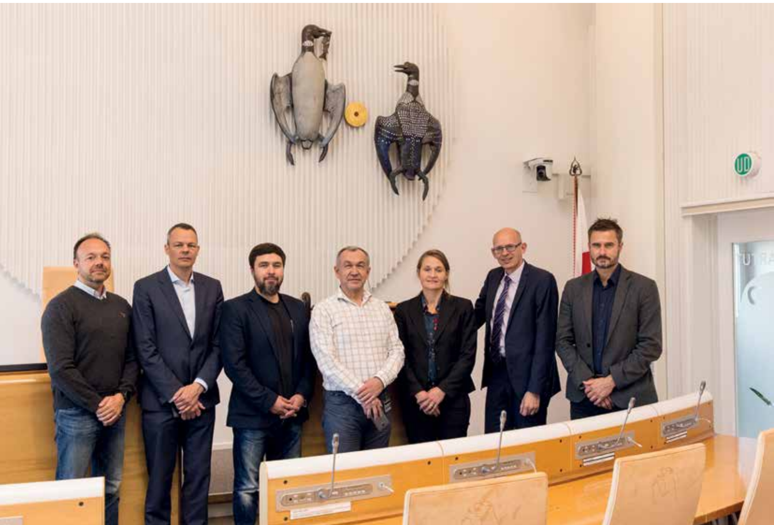
Den 19. september mødtes Udenrigs- og Sikkerhedspolitisk Udvalg med forskere fra Forsvarsakademiet.