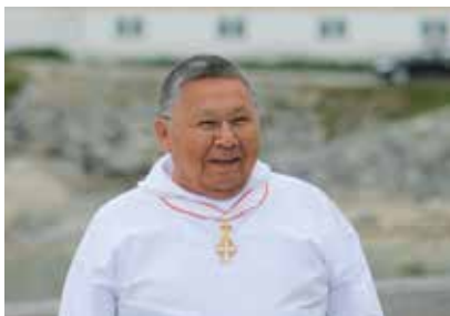
Formand for Inatsisartut Lars Emil Johansen