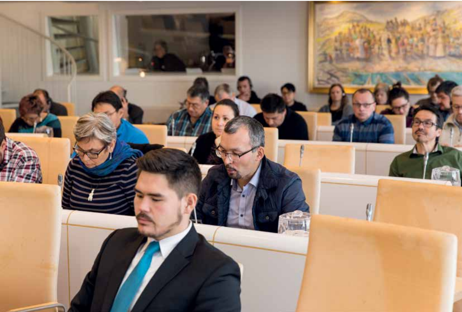
Efterårssamlingens 30. mødedag den 16. november.