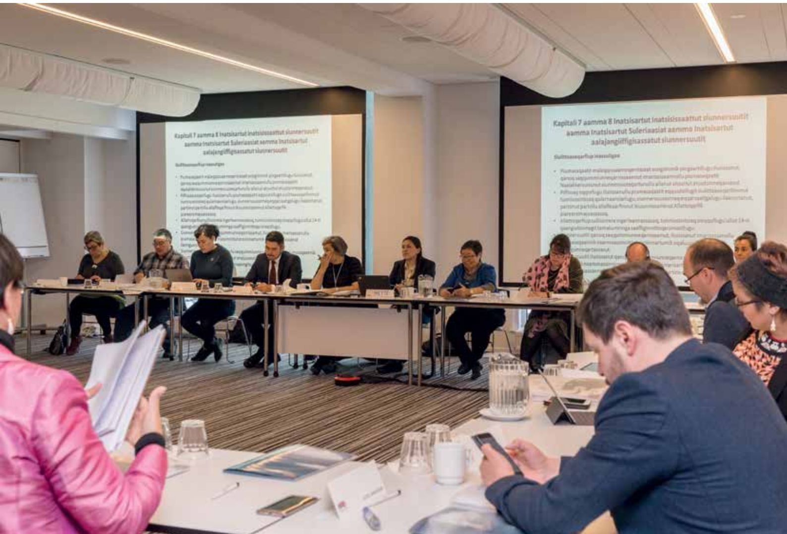
Den 10. november: Formandskabet gennemførte et seminar om Inatsisartuts forretningsordenen sammen med medlemmerne af Inatsisartut på Hotel Hans Egede.