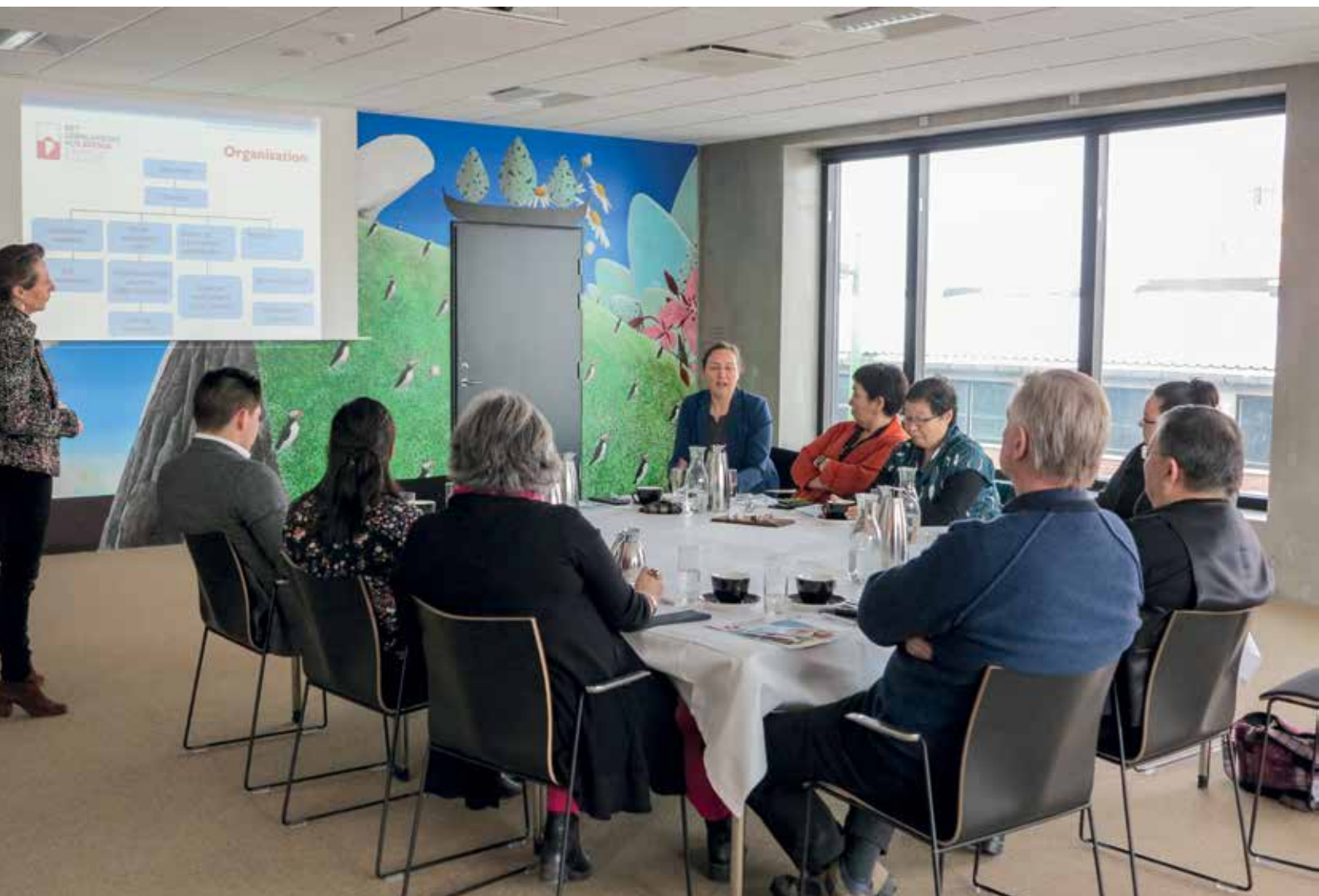
Den 9. februar: Formandskabet besøgte det Grønlandske Hus i Odense.