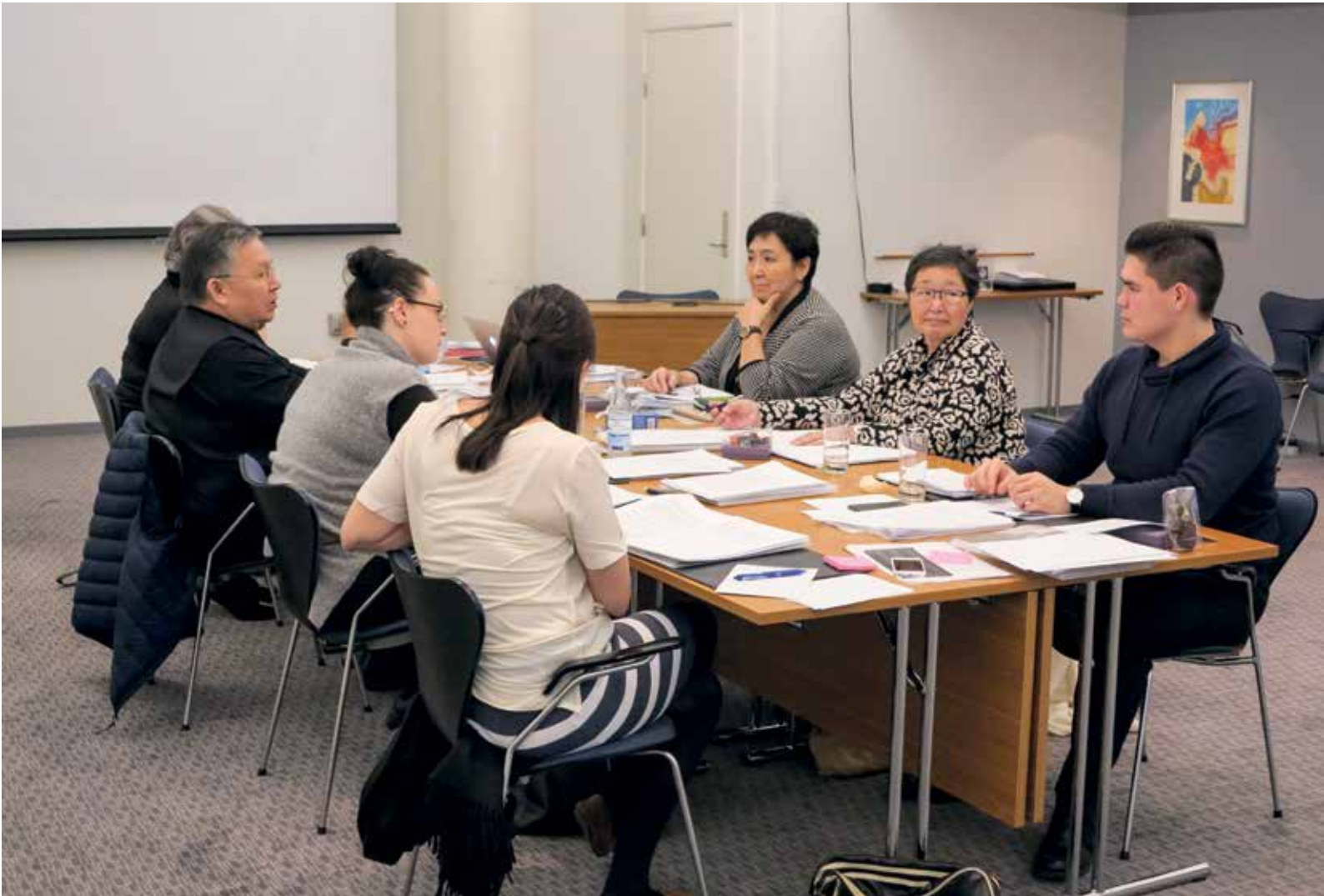
Den 8. februar: Formandskabet gennemførte et seminar i København.