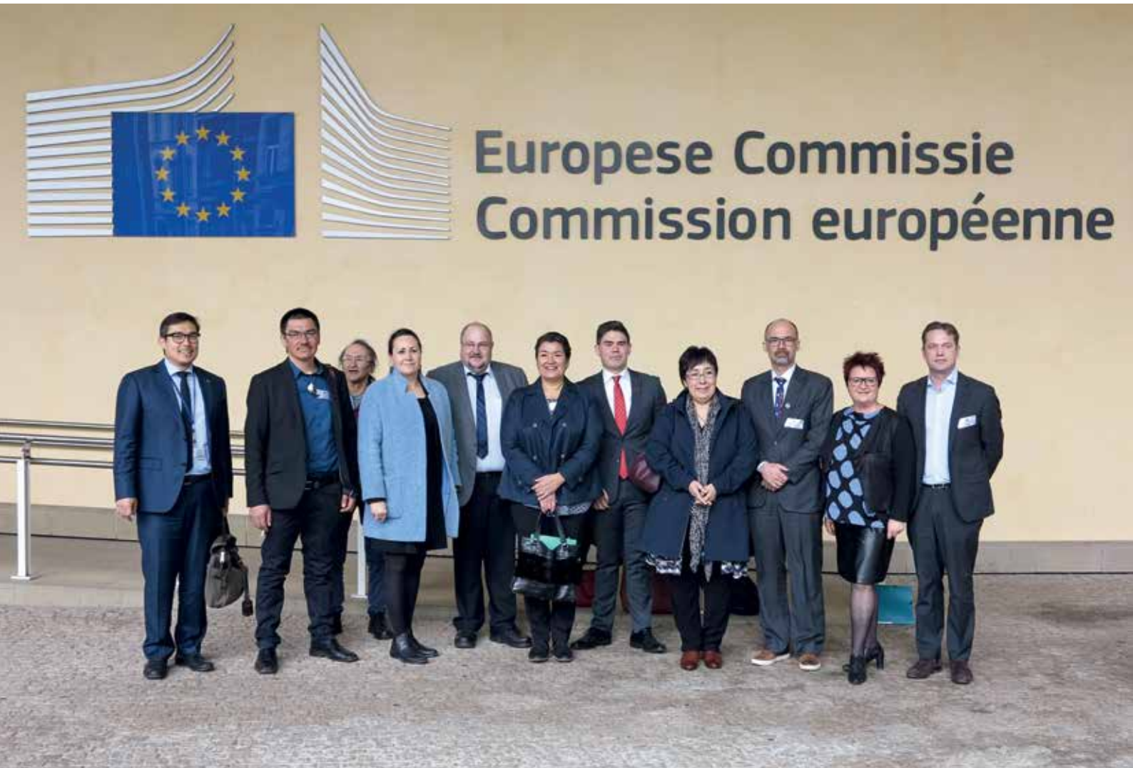
Den 20. marts var Fiskeri-, Fangst- og Landbrugsudvalget og Udenrigs- og Sikkerhedspolitisk Udvalg sammen med Folketingets Grønlandskudvalg i Bruxelles.