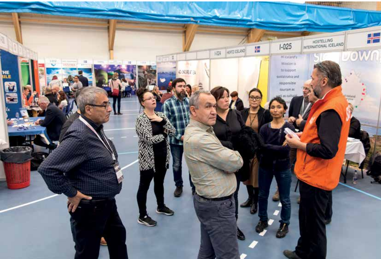
Erhvervs- og Råstofudvalg deltog i den vestnordiske turismekonference Vestnorden Travel Mart i Nuuk den 20. september.