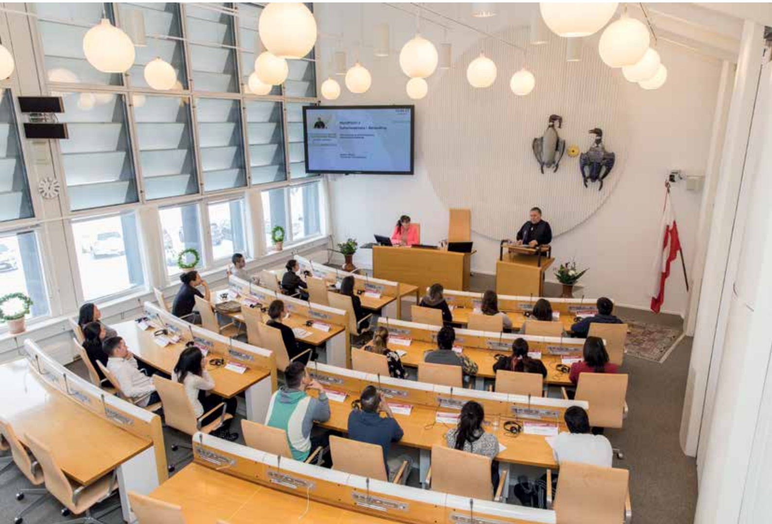
Formanden for Inatsisartut bød deltagerne til Ungdomsparlamentet velkommen.