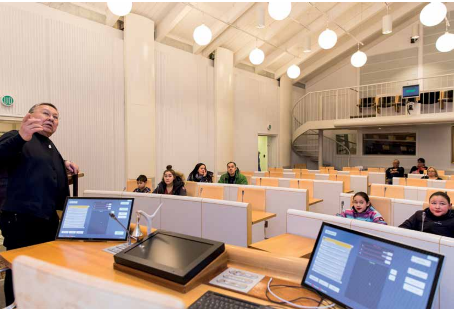
Formanden holder oplæg i Salen.