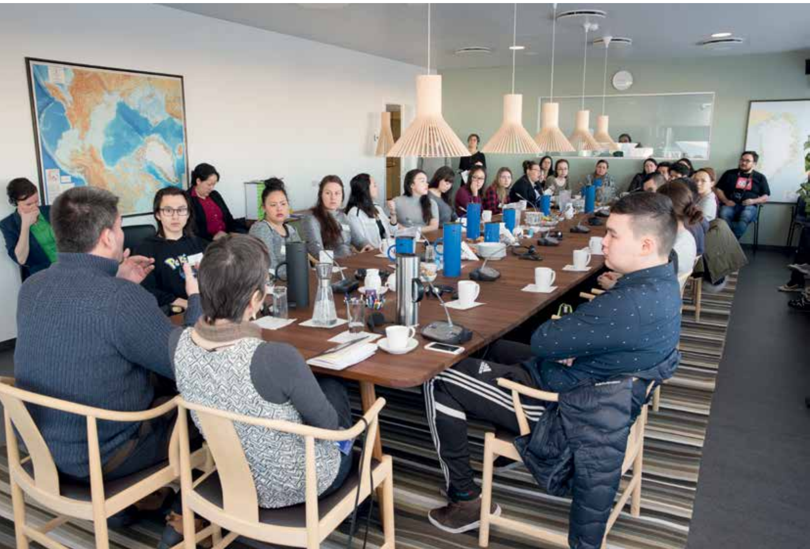
På Ungdomsparlamentets program stod blandt andet et møde med Formanden for Naalakkersuisut og Naalakkersuisoq for Selvstændighed.