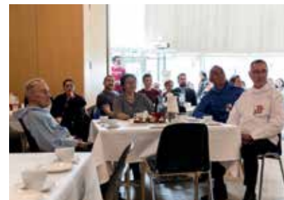
Markering af 50-års dagen for den første folkevalgte Landsrådsfor- mand Erling Høegh