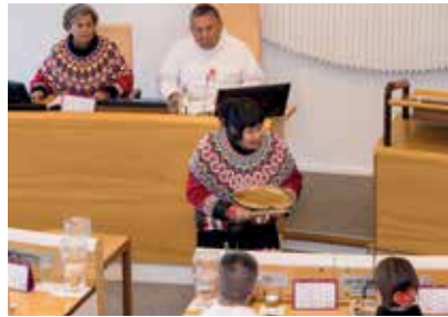
Efterårssamlingen indledes med trommedans for første gang