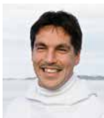
Aqqaluaq B. Egede