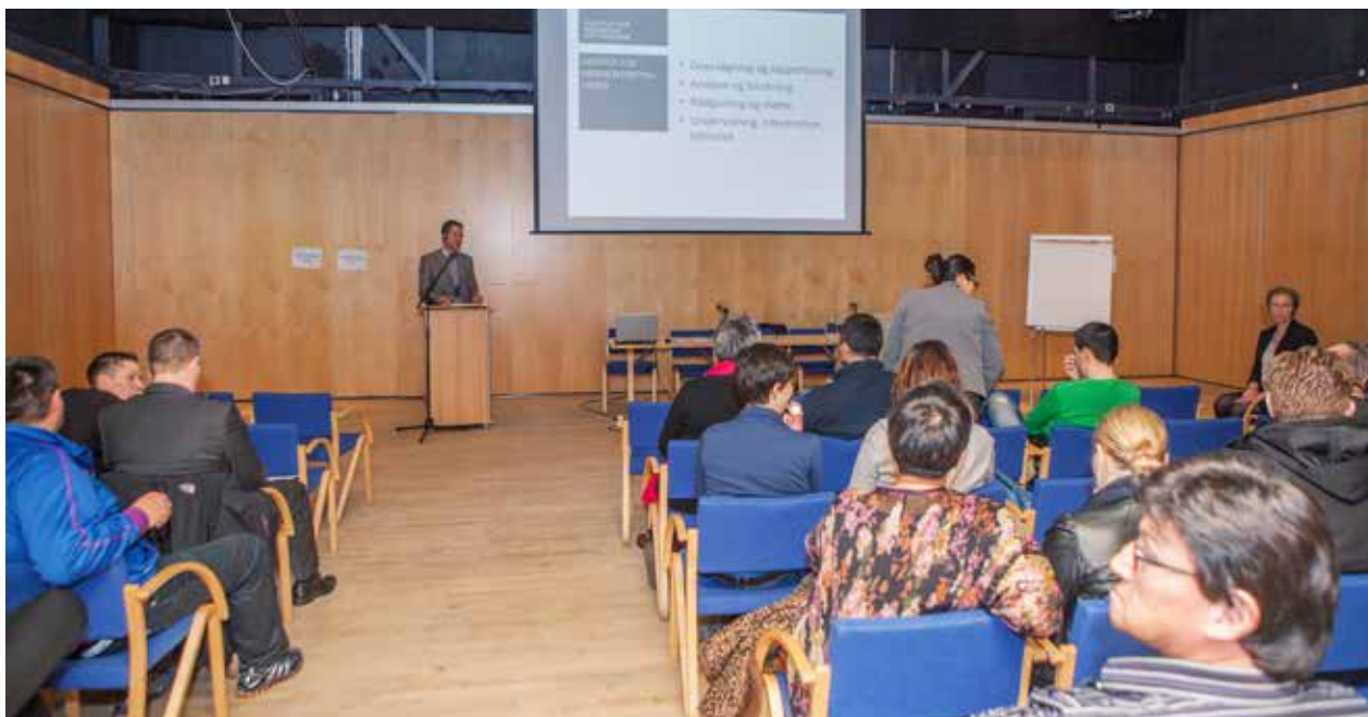
Seminar om menneskerettigheder i Katuaq.

den danske stat og dennes samfundsnormer. Institutet kan således være et medvirkende bindeled mellem det nationale og internationale samfund og mellem stat og civilsamfund.