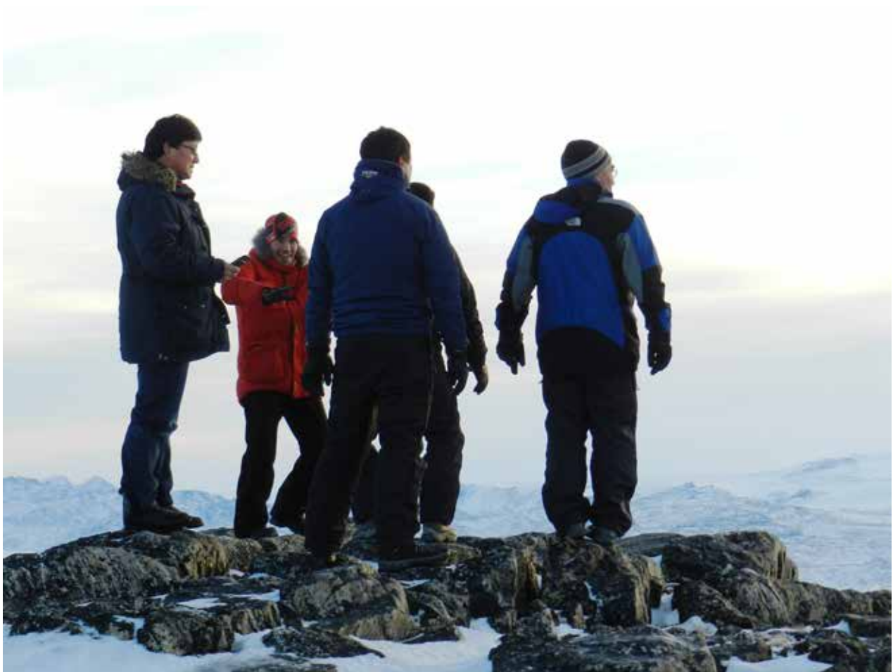
Udvalgsmedlemmer orienterer sig i området ved Tasersiaq.

19.- 22: januar. Møde og aktivitetsdage i Nuuk med henblik på at gennemføre møder i udvalget, orienteringsmøder og orienteringsbesøg.