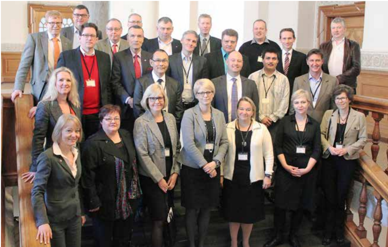
Møde i nordisk netværk for parlamentarisk revision i København.

8. november: Samråd med Naalakkersuisoq for Sundhed.