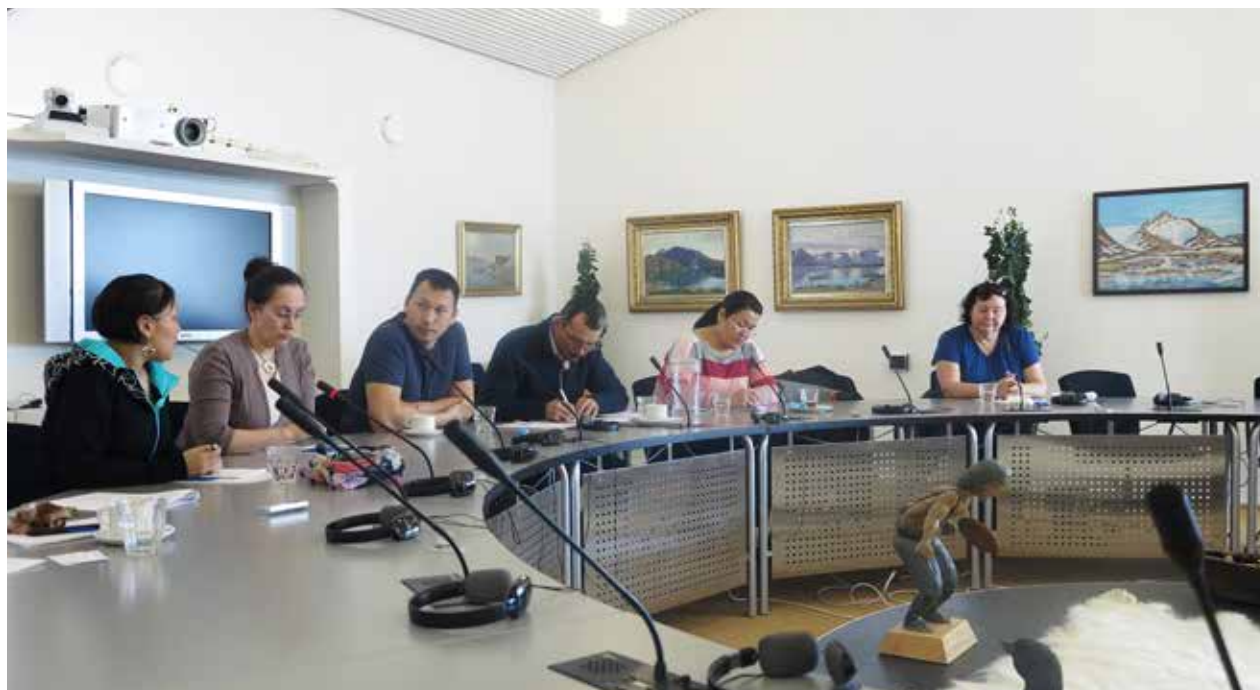
Orienteringsrejse til Qaasuitsup Kommunia 20. -26. marts.

25.oktober: Orienterings- og status møde tilrettelagt af inerisaavik med deltagelse af forvaltningschefer og pædagogiske konsulenter i forbindelse med forberedelses arbejde til den kommende Inatsisartutlov om pædagogisk udviklende tilbud til børn i førskolealderen.