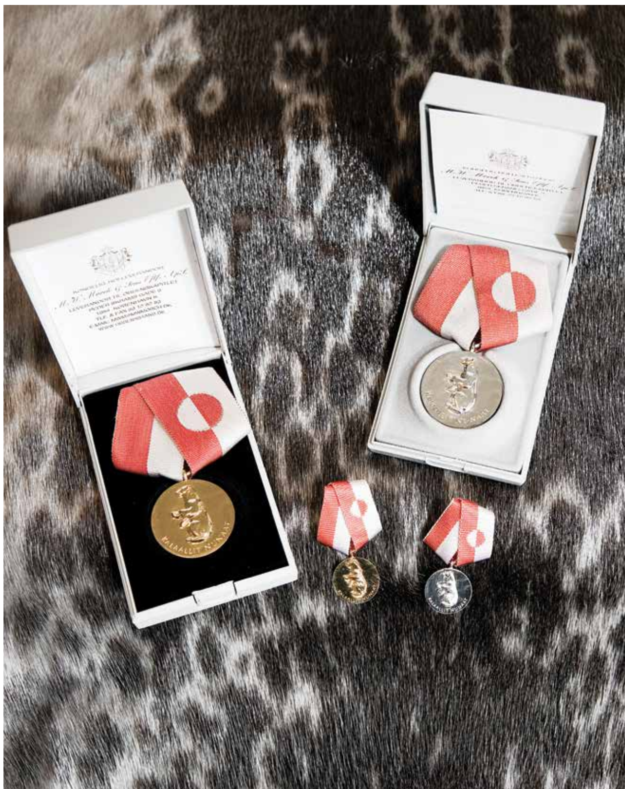
Nersornaat i guld og sølv.