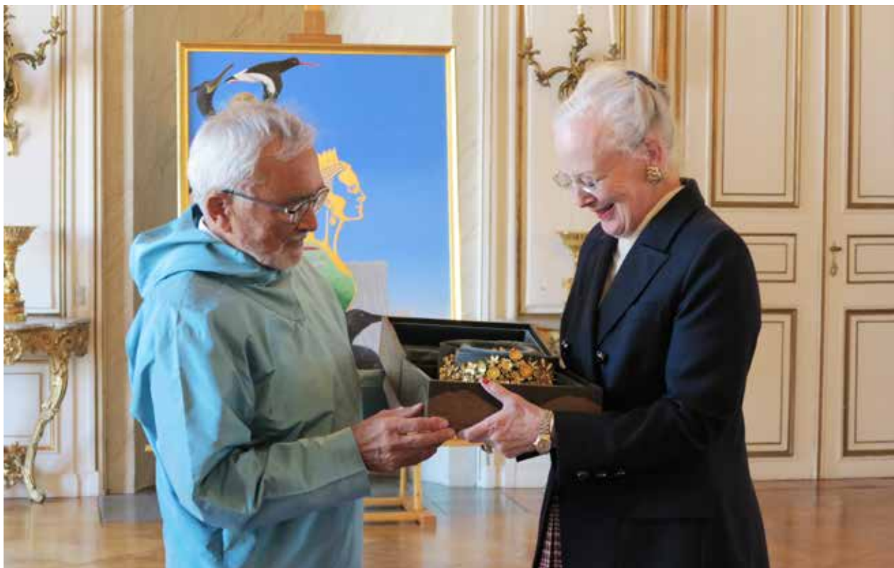
Overrækkelse af den færdige tiara til Dronningen på Amalienborg den 12. juni.

Den 13. januar var formanden for Inatsisartut sammen med formanden for Naalakkersuisut i audiens hos Dronningen på Amalienborg, hvor de præsenterede første del af den officielle gave fra Grønland til Dronningen i anledningen af hendes 40 årsjubilæum.