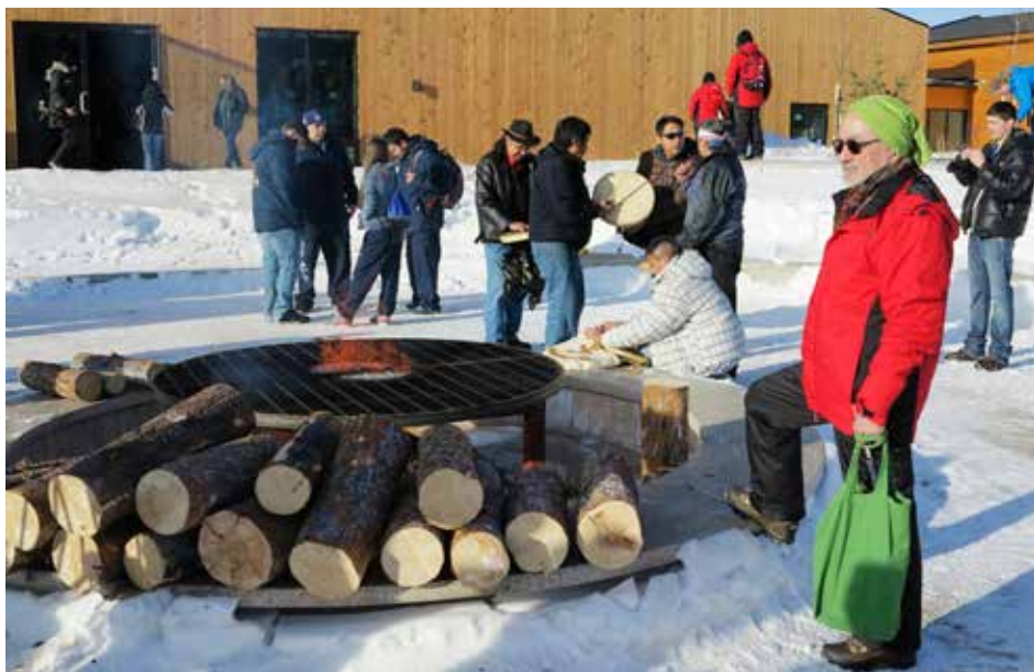
Den officielle tænding af ilden for Arctic Winter Games.

Formanden overværede forskellige sportsgrene som Inuit games, fodbold mellem Grønland - Alaska og volleyball mellem Grønland - Alberta, ligesom formanden deltog ved officielle receptioner under legene herunder den officielle tænding af "Ilden" for legene foran det nye kulturhus for provinsens indianske befolkning.