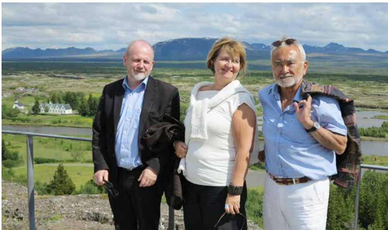
Formændene for Løgtingið Jógvan á Lakjuni, Alþingi Ásta R. Jóhannesdóttir og Inatsisartut Josef Motzfeldt.

De vestnordiske parlamentsformænd fra Færøerne, Island og Grønland mødes en gang årligt. Mødet i år fandt sted på Island den 26. og 27. juni. Fra Island deltog formanden for Alþingi Ásta R. Jóhannesdóttir, fra Færøerne deltog formanden for Løgtingið Jógvan á Lakjuni. Formændene orienterer hinanden om arbejdet i parlamenterne og udveksler erfaringer omkring parlamentariske forhold og eventuelle nye tiltag, der gøres for de 3 landes parlamentariske arbejde. Møderne går på skift mellem landene, således at næste møde afholdes i Grønland i 2013.