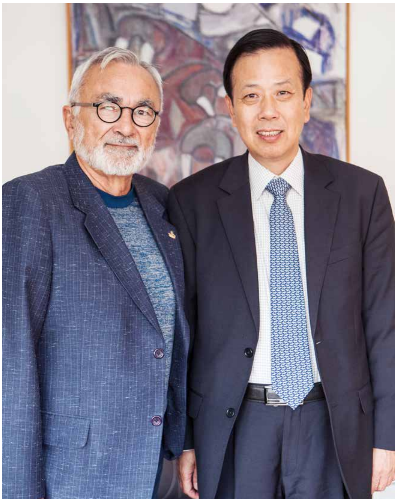
Besøg af den kinesiske ambassadør Mr. Li Ruiyu den 18. september i Inatsisartut.