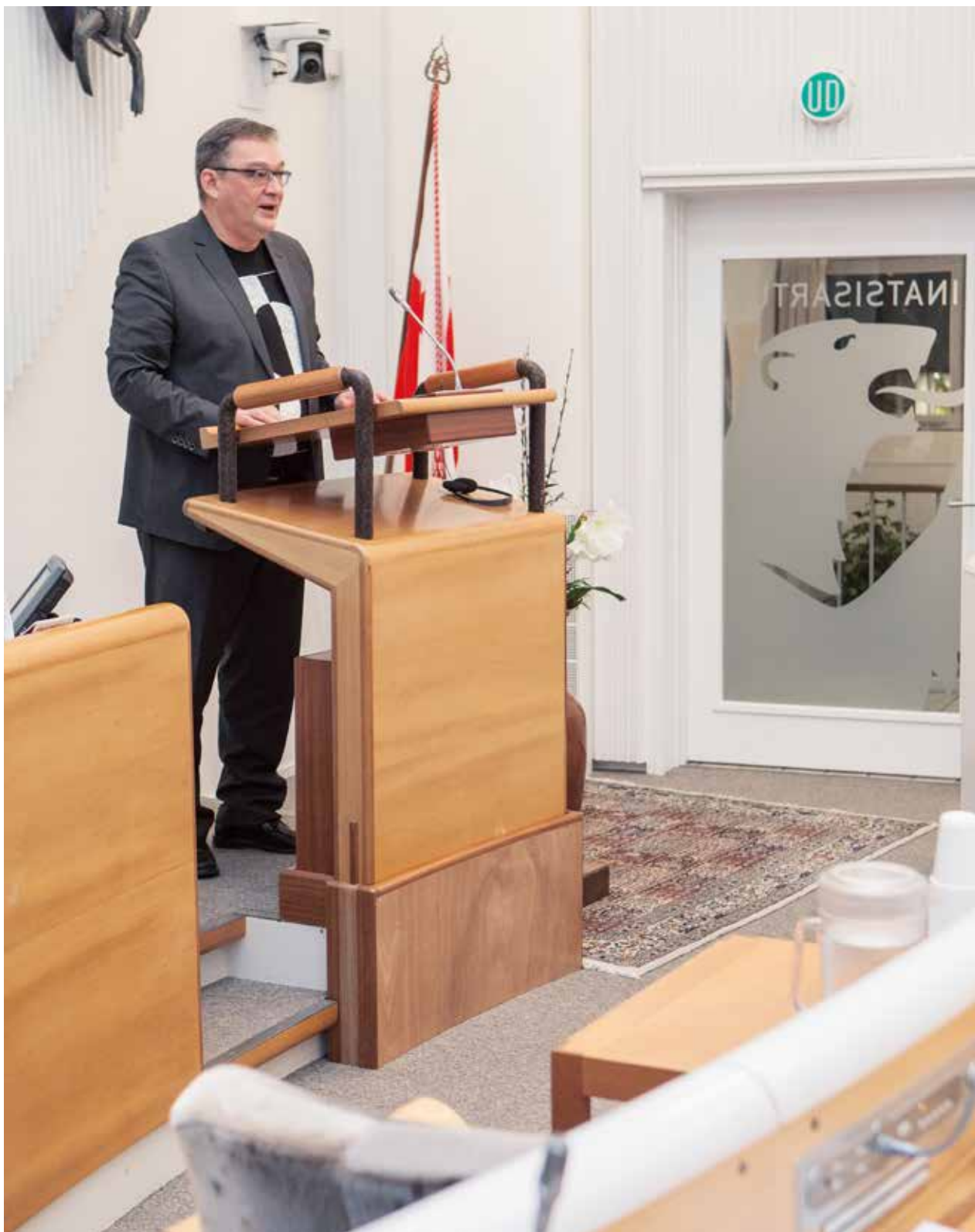
Formanden for Naalakkersuisut Kuupik Kleist på talerstolen i Salen.