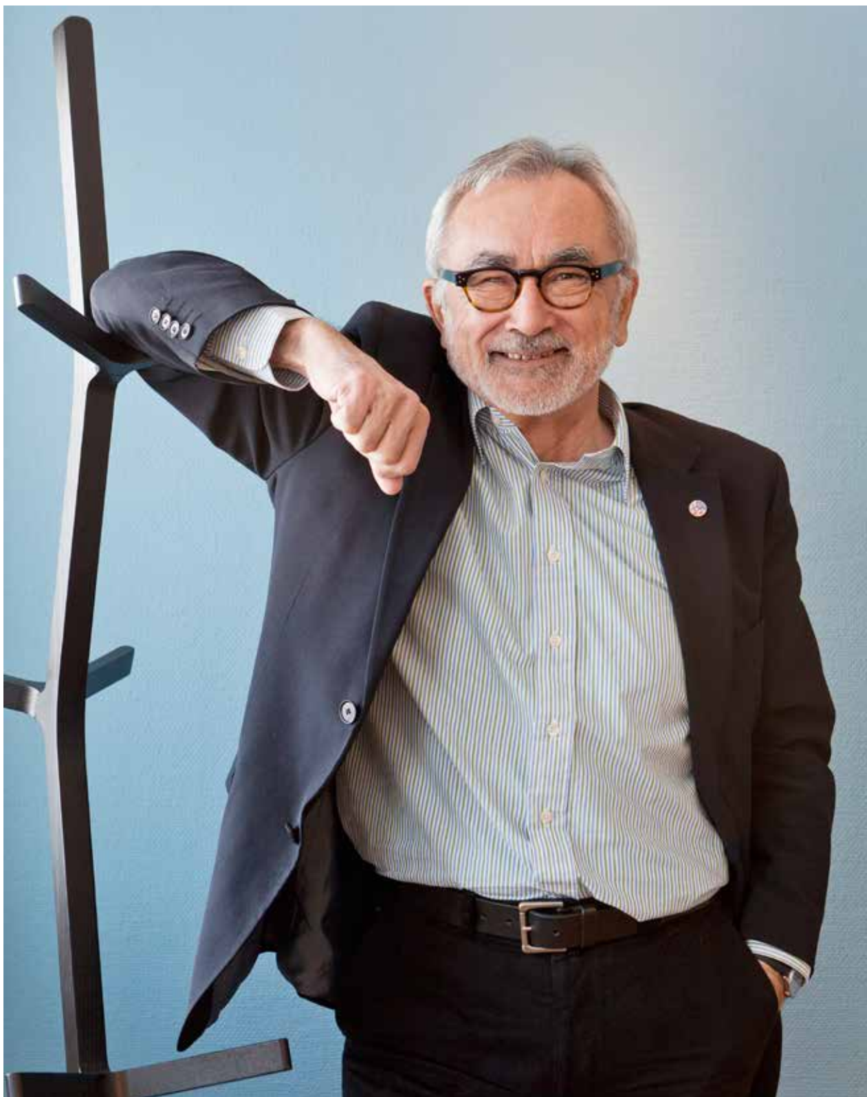
Tidligere formand for Inatsisartut Josef Motzfeldt.