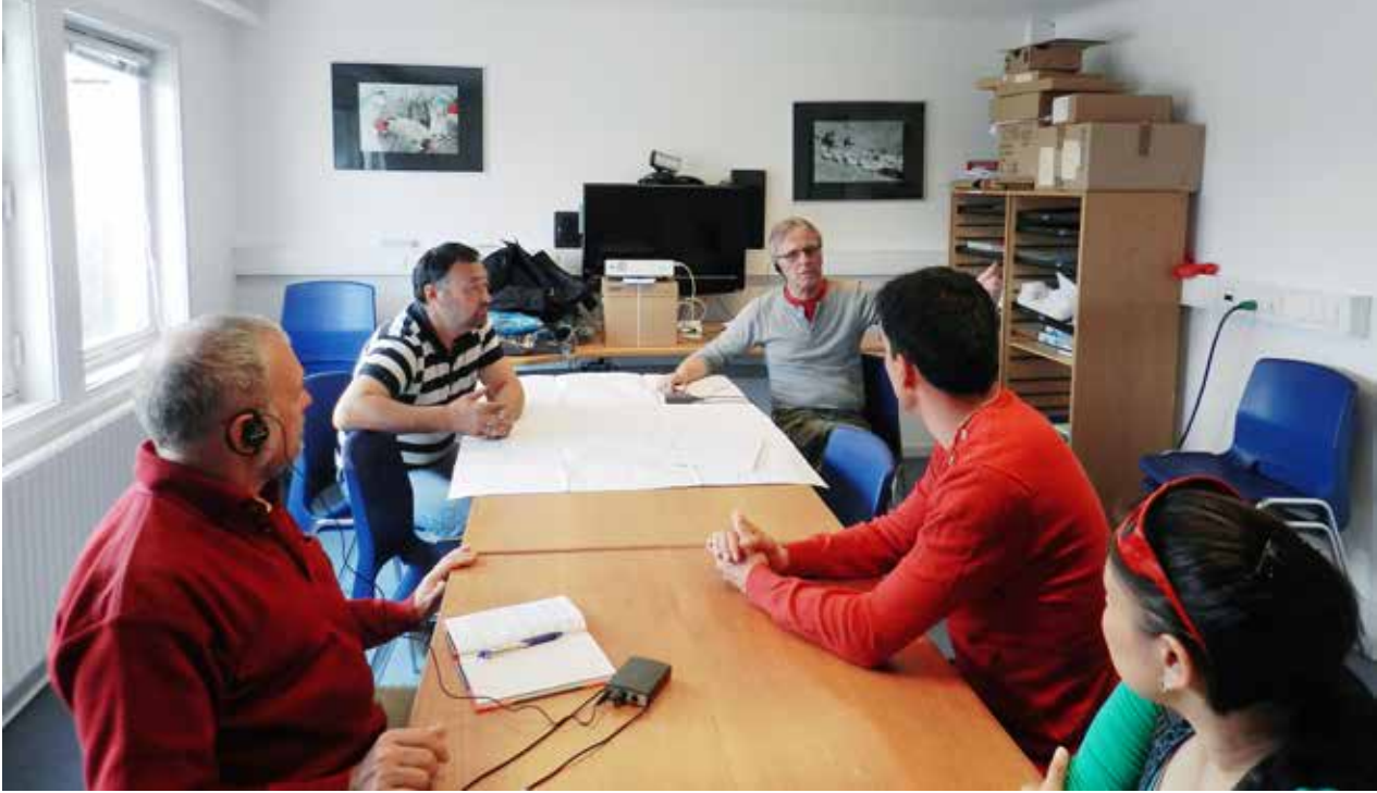
Besøg på Neqi