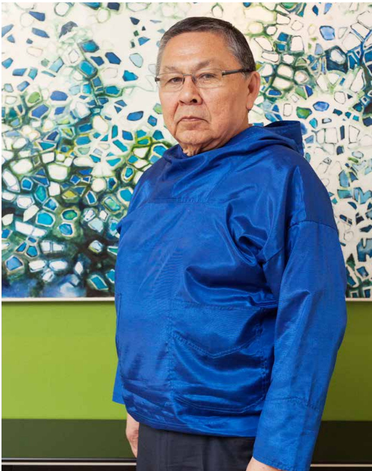
Formanden for Inatsisartut Lars-Emil Johansen.