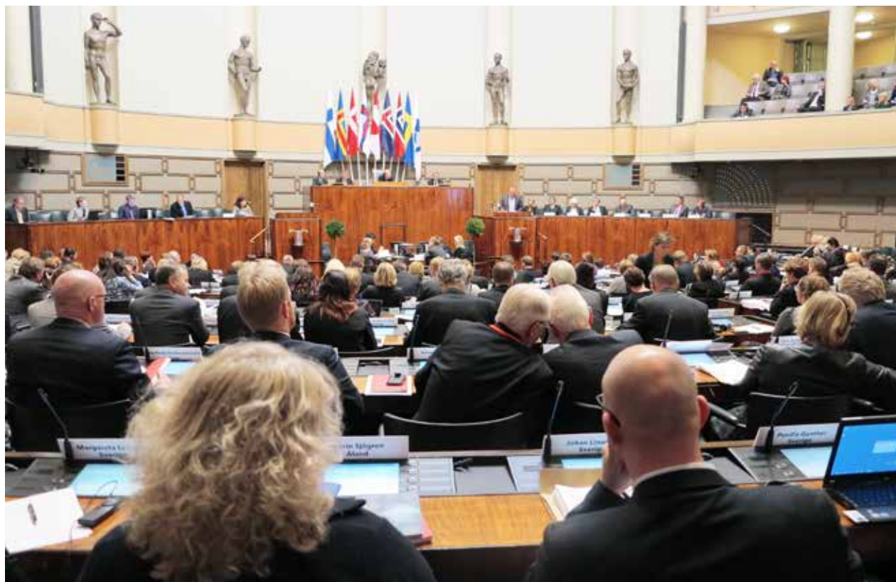
Nordisk Råds 64. session i Helsingfors, Finland.

25.-29. juni. Næringsudvalget i Nordisk Råd havde i 2012 henlagt udvalgets sommerrejse til Grønland. Udvalget gennemførte orienteringsmøder og orienteringsbesøg i Ilulissat og Nuuk. Temaet for orienteringsbesøget var erhvervs- livet i Grønland og udviklingsmulighederne indenfor dette. Bureau for Inatsisartut bistod omkring planlægning og gennemførelse af orienteringsbesøget.